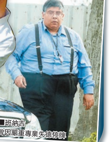
班納吉曾因嚴重專業失德停牌