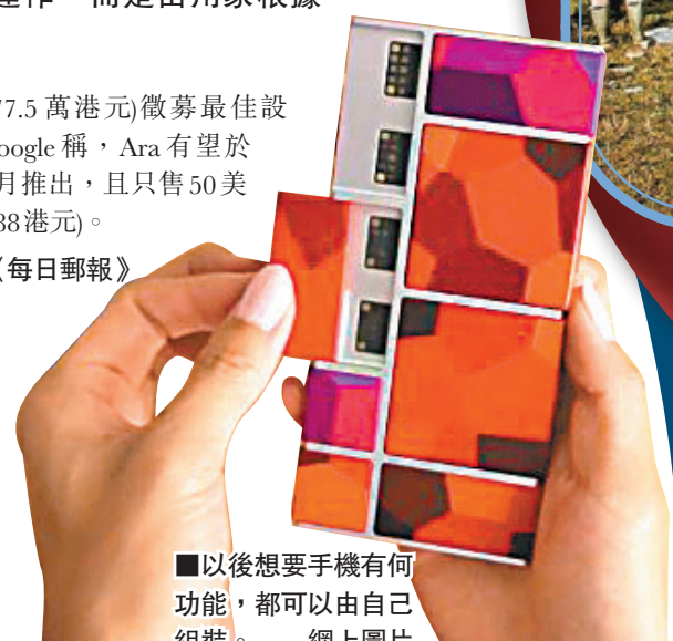
以後想要手機有何功能，都可以由自己組裝。網上圖片