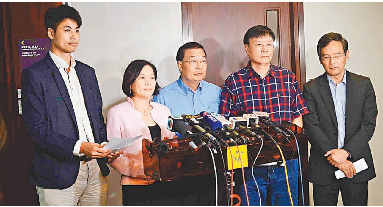
■建制派昨日發表聲明,譴責反對派議員濫用程序,令議會混亂。

他批評,反對派提出的規程問題,只是利用「規程問題」名義令議會不能運作,而反對派亦有不少資深議員,他們應撫心自問是否按照議事規則行事。對於反對派計劃對會議合法性提出司法覆核,他認為這是反對派「賊喊捉賊」的伎倆及「做騷」的表現,全港市民也看