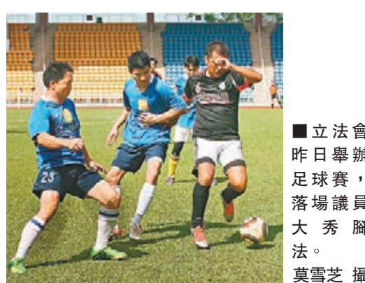
■立法會昨日舉辦足球賽,落場議員大秀腳法。