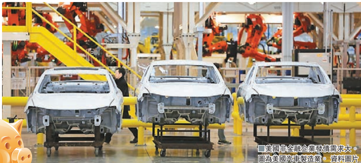
美國非金融企業發債需求大。圖為美國汽車製造業。

企業債由於波動較股市低、又與股市具有較高互動，今年歐美經濟溫和復甦訊號明顯，帶動標普全球企業債指數今年漲了4.79%，投資者倘若憧憬景氣復甦愈趨明朗，會讓企業債債市在低利率環境下，成為市場的關注點，不妨留意佈局建倉。 ■梁亨