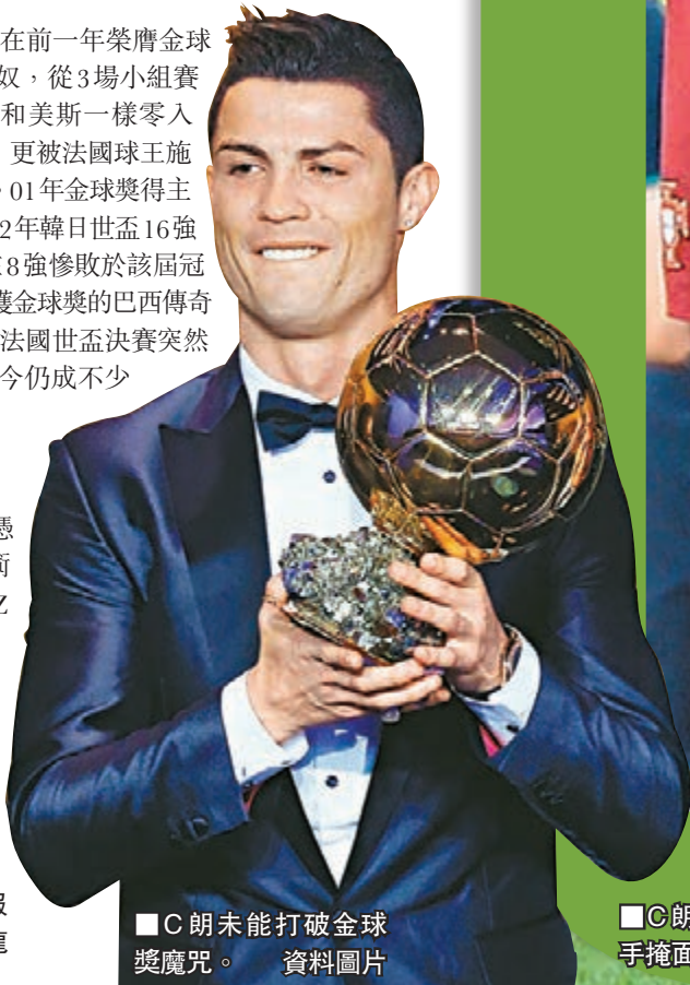
C朗未能打破金球獎魔咒。資料圖片