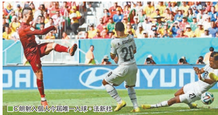
C朗射入個人今屆唯一入球。

C·朗拿度(C朗)昨日在G組葡萄牙對加納的賽事入波，打破今屆世界盃入球荒，更為葡萄牙贏得今屆世盃首場勝利，但無助出線，最終黯然結束巴西之旅。C朗至今已射入葡國史上最多的50球，締造多項國足紀錄，可惜隊友質素有限，獨力難支，難以延續10年前「黃金一代」輝煌史。