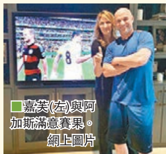
嘉芙(左)與阿加斯滿意賽果。

德國在最後一場G組分組賽以1:0小勝美國，奪得小組首名，而美國則以小組次名躋身16強，皆大歡喜，這場比賽的結局對網壇樞腕夫妻阿加斯和嘉芙來說更是完美。阿加斯和嘉芙這對「美德」跨國夫婦，恰逢二人的祖國在世界盃相遇，儘管德國戰勝美國，但是兩隊攜手出線，因此兩位在電視機前合影也是笑容滿面，皆大歡喜。