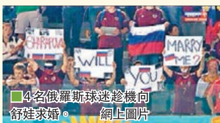
4名俄羅斯球迷趁機向舒娃求婚。網上圖片

俄羅斯在H組最後一戰門阿爾及利亞爭出線，吸引得俄羅斯美女網球手舒拉娃觀戰，在電視直播中，「舒娃」看到有4名粉絲舉牌向自己求婚，她立即於Twitter上留言說：「我錯過了入球，但沒有錯過這一幕……4個人我都要嫁？」