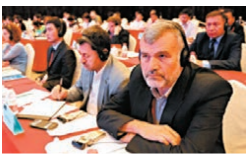
多國相關學者與官員共商「絲路」旅遊大計

香港文匯報訊(記者 馬晶晶 新疆報導) 由新疆維吾爾自治區人民政府和國家旅遊局聯合主辦的中國國際「絲綢之路」旅遊發展會議日前在烏魯木齊舉辦,來自俄羅斯、蒙古、土耳其、瑞士、新加坡等14個國家的30餘位相關學者與官員共商「絲綢之路」旅遊大計。14國還聯合發表宣言,將合作發展「絲路」旅遊。