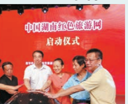
湖南長沙辦紅色旅遊節

香港文匯報訊(記者 彭英、董曉楠 湖南報導) 紀念通道轉兵80周年大型主題活動、中國紅色旅遊文化節、懷化第四屆「三古」文化旅遊節昨日在湖南長沙舉行。湖南省委常委、省委宣傳部部長許又聲為萬輛自駕車遊活動授旗,並啟動中國湖南紅色旅遊網。 據介紹,本屆紅色旅遊文化節即日起持續至年底,以「紅色通道 美麗侗寨」為主題,主題活動將於12月12日在懷化市通道縣紅軍長征通道會議紀念廣場舉行。其間還將舉辦紀念「通道轉兵」80周年百來個錦長卷公益主題活動、紀念座談會,恭城書院紀念館開館儀式,懷化市「三古」文化旅遊推介會等活動。 據悉,去年湖南全省主要紅色旅遊區(點)接待國內外旅遊者6000萬人次,實現紅色旅遊綜合收入350億元。