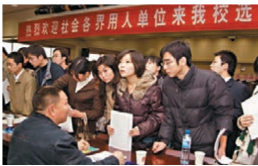
陝西推托底安置 助大學生就業