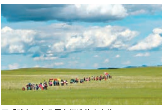
「驢友」在草原上行進徒步之旅

香港文匯報訊(實習記者 馮芳慧 內蒙古報導) 近日,第三屆烏拉蓋河徒步溯源之旅拉開帷幕,共有來自全國20個省區175名徒步愛好者參加,是歷屆徒步活動中覆蓋地區最廣、參與人數最多的一次。 據介紹,本屆活動起點是烏拉蓋管理區所在地巴音胡碩鎮,終點是烏拉蓋河源頭寶格達山,共安排了3天、5天、7天三種不同難度的路線,每天行進30公里,全程行進7天半共210公里。在每段路線結束後,主辦方會為走完相應路線的「驢友」頒發銅、銀、金質紀念章,還將為連續三年徒步走完全程的「驢友」發放紀念品。 此次徒步相比去年對行進路線的前四站進行了重新劃,更多地增加了烏拉蓋的其他自然景觀,其中《狼圖騰》影視拍攝基地也首次被列入新的行進路線裡。