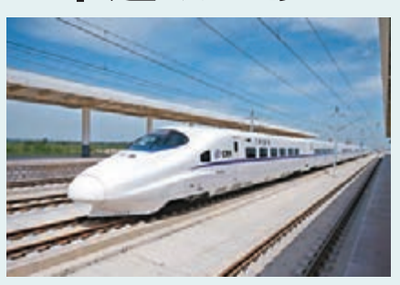
山西大西高鐵下月通車

香港文匯報訊(記者 楊光 太原報導) 大(同)西(安)高鐵太原至西安段7月1日起將正式通車。沿線的旅遊業界已感到巨大的商機就要來臨。記者日前從太原市旅遊局了解到,本月26日,為期四天的「京冀晉陝」高鐵旅遊城市聯盟成立暨旅遊推介系列活動在太原舉行。 來自北京、保定、石家莊、陽泉、太原、晉中、忻州、朔州、大同、臨汾、運城、渭南、西安共13個市的旅遊界代表,以聯盟的總體形象出現,聯合參加各類國內、國際旅遊展會,共同打造「京冀晉陝」高鐵旅遊城市聯盟整體旅遊品牌。 大西高鐵全長859公里,運行時間縮短到4個小時。太原還將構建起「十」字形高鐵格局,進一步拉近山西省內及周邊省市的旅遊市場距離。