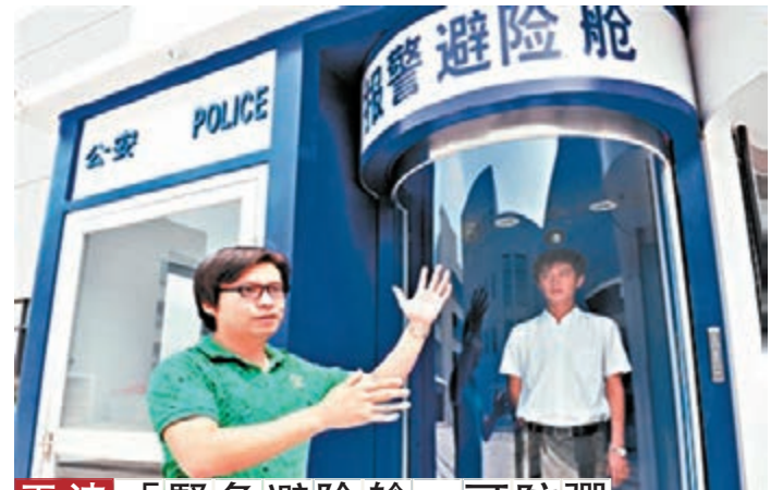
天津「緊急避險艙」可防彈

香港文匯報訊(記者 張麗利 吉林報導) 據悉,南航將於下月11日起恢復長春至海拉爾往返航線,航班號CZ6461/2,每日一班。此航線豐富了長春出港的航線網絡,為想要去呼倫貝爾大草原避暑的旅客提供了更多便利。該航班具體運行時刻為上午8時10分長春起飛,9時50分到達海拉爾機場;上午10時40分海拉爾起飛,12時30分到達長春機場。