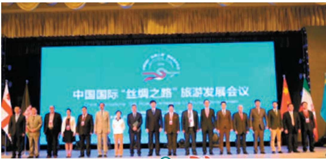
14個國家代表合影留念

據了解,這14個國家聯合發表的《「絲綢之路」旅遊烏魯木齊宣言》,提出將合作發展「絲綢之路」旅遊,各國之間互為「絲綢之路」出境旅遊目的地。會後,各與會代表赴天山天池、吐魯番等地考察。