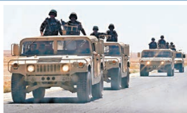
伊拉克局勢緊張，約旦向邊境增兵。

美國總統奧巴馬上周宣布向伊拉克增派約300名軍事顧問，負責評估美方支援伊政府的方案。首批150人已陸續進駐巴格達，開始評估伊保衛隊戰鬥力及遜尼派武裝組織「伊拉克與黎凡特伊斯蘭國」(ISIL)的攻勢，並着手在巴格達和伊北籌建聯合作戰中心。