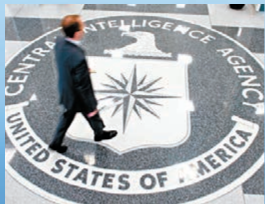
中情局愈來愈倚重亞馬遜的雲端系統。

美國中情局(CIA)首席情報官沃爾費前日罕有地公開發言，指中情局愈來愈倚重亞馬遜的電腦雲端系統，將使用該系統分析情報。