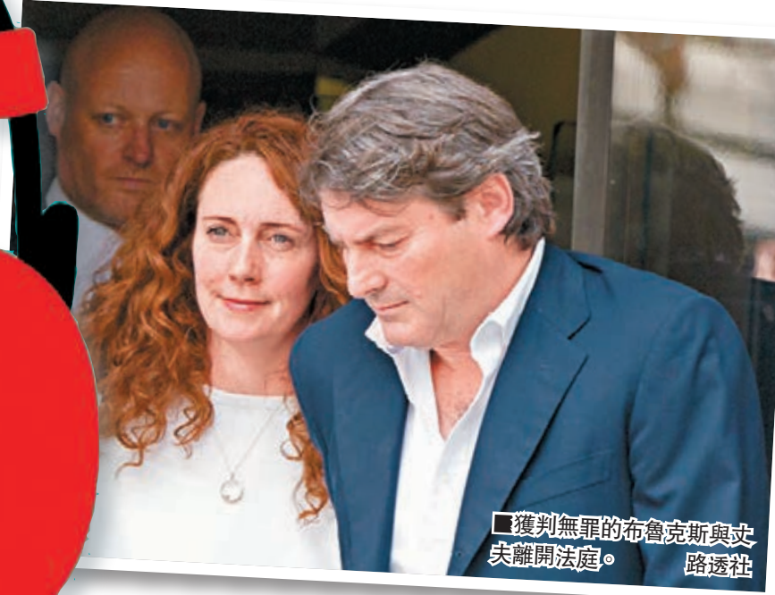
獲判無罪的布魯克斯與丈夫離開法庭。