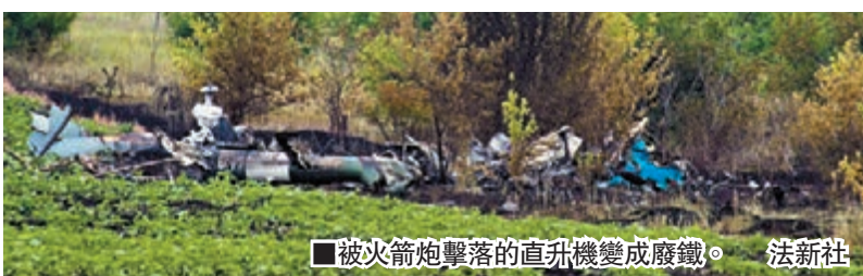
被火箭炮擊落的直升機變成廢鐵。

烏克蘭政府周一與烏東武裝分子達成停火協議，但衝突未見平息，前日更有一架烏軍直升機在烏東遭武裝分子擊落，機上9人全部遇難。總統波羅申科尋求與俄羅斯總統普京緊急對話，商討局勢發展；又下令烏軍若遭攻擊「毫不猶疑還火」，更不排除可能提前取消停火令。