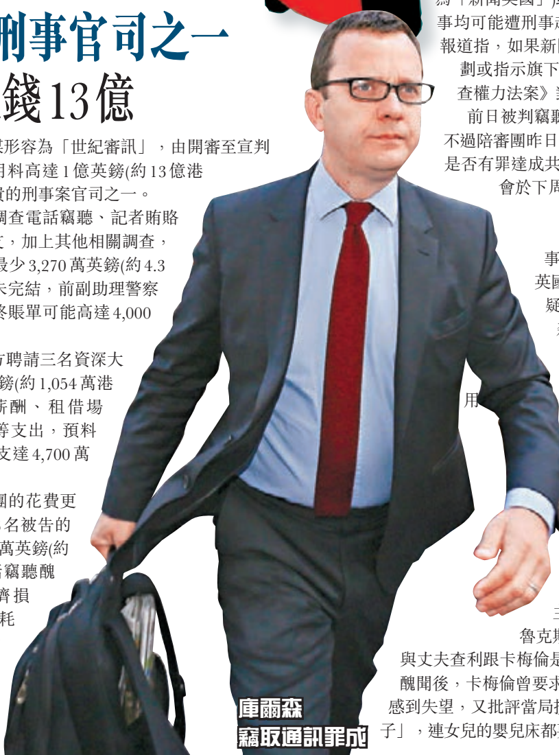
庫爾森竊取通訊罪成