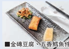
金磚豆腐、五香鱈魚件、椒鹽秀珍菇