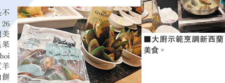
大廚示範烹調新西蘭美食。