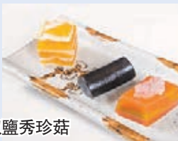
花膠鮑汁薑葱撈麵及三款甜點懷舊蛋黃千層糕、黑白芝麻卷、燕液棗糕等。