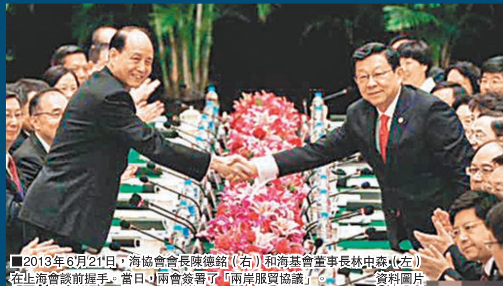
2013年6月21日，海協會會長陳德銘(右)和海基會董事長林中森(左)在上海會談前握手。當日，兩會簽署了「兩岸服貿協議」。

去年6月21日，兩岸兩會在上海簽署《海峽兩岸服務貿易協議》。但一年來，兩岸服貿協議在台灣立法機構遲遲不能審查通過，是兩岸兩會前9次會談簽署的19項協議中，唯一未能如期生效的協議。台灣「經濟部商業司」早前修正《大陸地區營利事業在台設立分公司或辦事處許可辦法》，規定大陸公司來台設立辦事處，不得涉及安全、軍方投資，同時必須每會計年度提出「工作報告書」及經費預算，違者可撤銷許可。