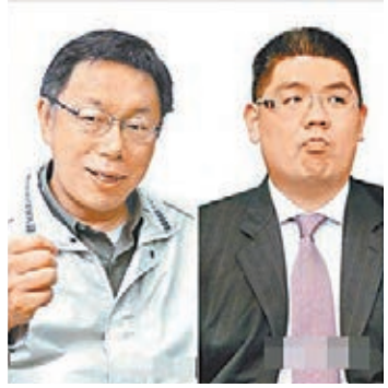
柯文哲(左)與連勝文展開競選之爭。

香港文匯報訊 據中通社報道，台北市長選舉年底舉行，但藍綠選戰已經打響。台北市長在野黨參選人柯文哲出線後，積極向前民進黨主席蘇貞昌、謝長廷借將。國民黨籍參選人連勝文則爭取到新黨公開支持。據台媒報道，柯文哲20日拜會謝長廷後，就傳出蘇貞昌核心幕僚李厚慶、謝長廷辦公室發言人林鶴明，紛紛將出任柯文哲文宣與媒體系統幹部。據了解，柯文哲已向蘇貞昌與謝長廷徵詢，並獲得支持。另一方面，新黨主席郁慕明則表示，為了大局，台北市長選舉他公開支持代表國民黨的連勝文。目前藍營尚有親民黨未表態。