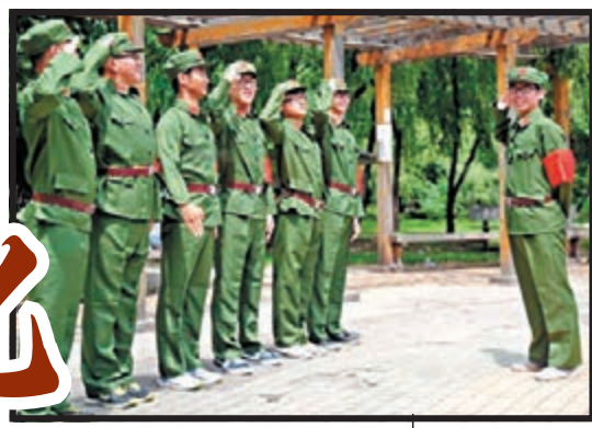
扮紅衛兵敬禮。

眼下正值大學畢業時節，許多大學生紛紛曬出個性畢業照，然而黑龍江一所大學的畢業生玩得出格，他們扮成文革紅衛兵的模樣「批鬥」同學，一段中國人的黑暗記憶，在這些大學生眼裡卻成為遊戲。照片一經網絡曝光，即引起了網民的炮轟，紛紛批評大學生「褻瀆歷史」。