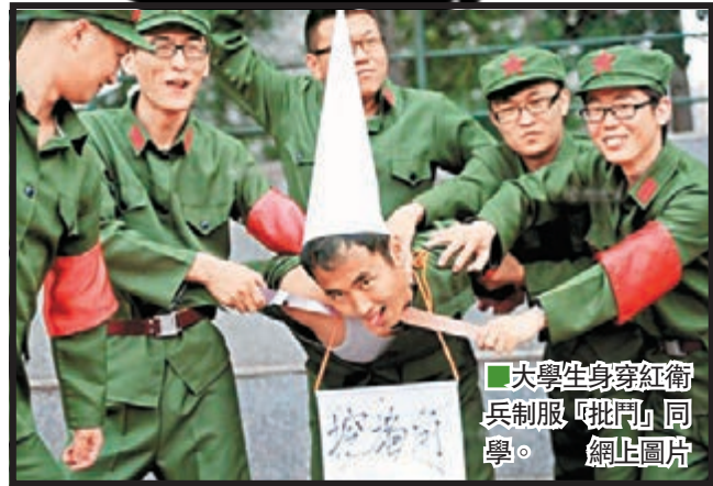
大學生身穿紅衛兵制服「批鬥」同學。

在網上曝光出格的這組畢業照共有四張。其中第一張最為誇張。五名男同學身穿世紀特有的軍裝樣式服裝，用皮帶將另外一名男生脖子捆住，並模仿文革批鬥時紅衛兵的姿勢將其「押解」。被「批鬥」的男生頭戴白色高帽，脖子上掛着寫有「挖牆角」字樣的牌子，伸出舌頭裝出一副挨打的模樣。之後幾張則或為一些男生身穿綠色軍裝服戰隊敬禮，或是蹲下抽煙的照片。