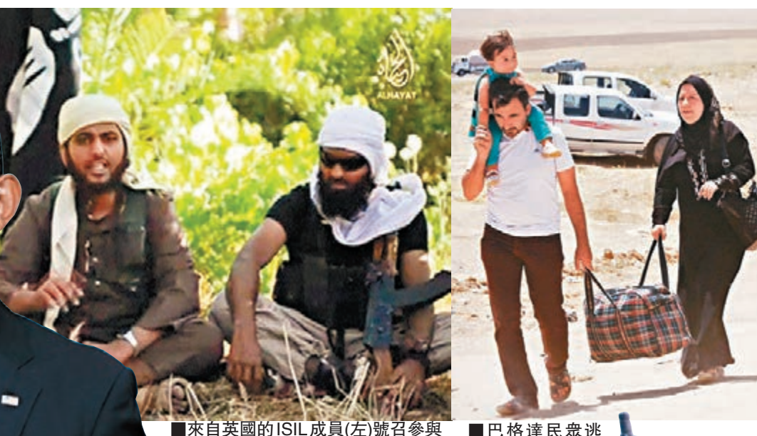
來自英國的ISIL成員(左)號召參與伊拉克及敘利亞衝突。