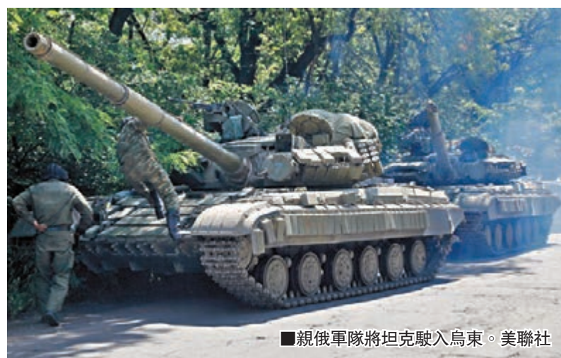
親俄軍隊將坦克駛入烏東。

烏克蘭代理國防部長科瓦利昨日表示，軍方已奪回烏俄接壤邊境的控制權，防止武器從俄羅斯流入支援分離主義分子。總統波羅申科前與俄總統普京兩度通電話後，昨日發布14點和平計劃《烏東邁向和平方案》，冀於10日後實施。