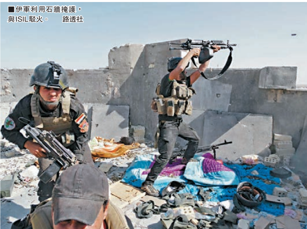
伊軍利用石牆掩護，與ISIL駁火。