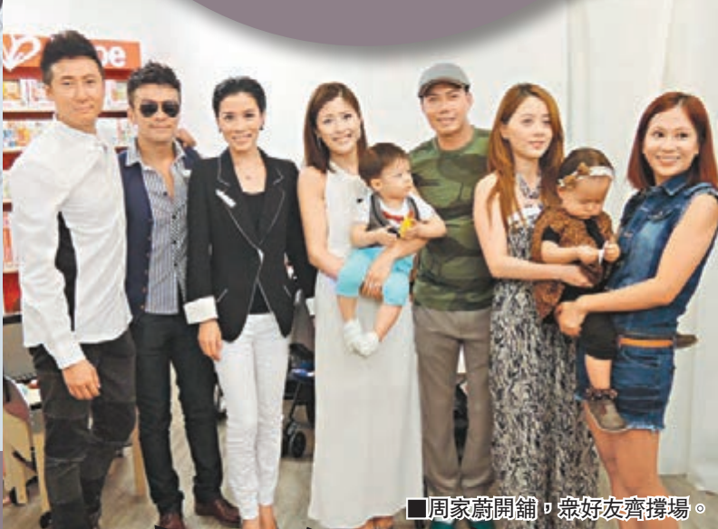
周家蔚開店望一年歸本