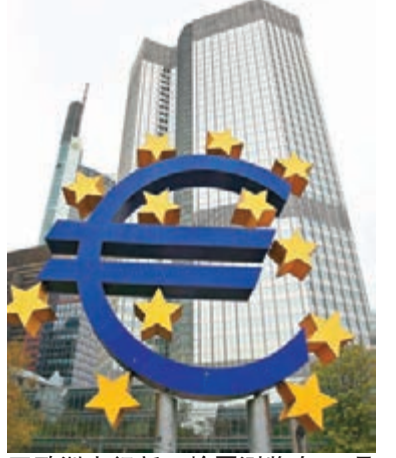
歐洲央行新一輪壓力測試將在10月完結。