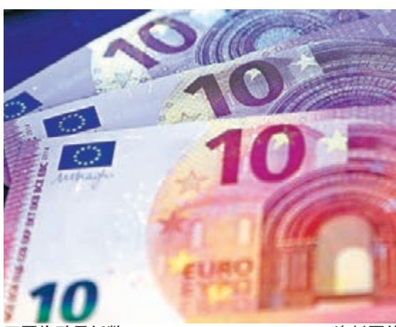
圖為歐元紙幣。

歐元本月初受制1.3670美元附近阻力後，持續遇到下調壓力，一度於周四反覆走低至1.3510美元附近的1周低位。今次歐元跌幅擴大，除了受到歐洲央行上周四作出降息行動影響，部分歐洲央行管理委員在本周早段繼續表示歐洲央行有需要時會推出更多寬鬆措施，該些因素導致市場氣氛進一步不利歐元，令歐元輕易失守1.36美元水平。但隨著歐盟統計局周四公布4月歐元區工業生產按月上漲0.8%，按年更有1.4%升幅，顯著好於3月表現，歐元跌幅逐漸受到限制，略為作出反彈，並且於周五時段走高至1.3578美元附近，舒緩連日來的下跌走勢。