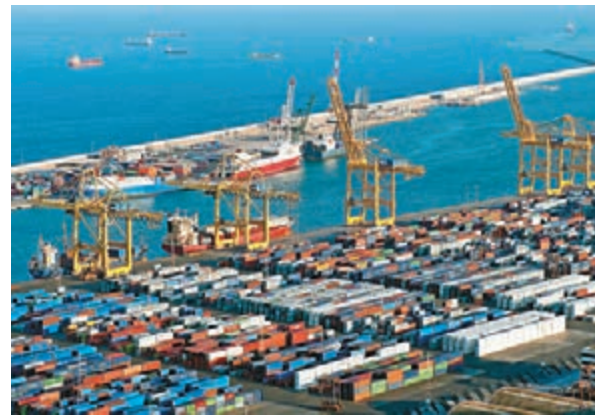
圖為西班牙巴塞羅那貨櫃碼頭。資料圖片

資產地區分布為20.91% 英國與愛爾蘭、19.25% 地中海、12.31% 德國與澳大利亞、10.61% 獨聯體與東歐、8.51% 荷盧三國、8.12% 法國、2.92% 拉美、2.57% 美國與其他美洲、1.63% 日本以外亞太地區、1.34% 瑞士、1.27% 中東與非洲地區、0.81% 斯堪