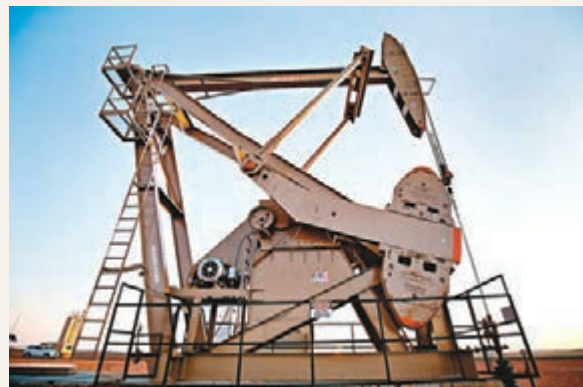
資料顯示，能源基金已連續12周呈現淨流入。圖為美國油井。

搶搭能源旺季列車，該如何挑選投資標的呢？建議秉持3大原則，首先，投資策略宜選擇側重上游產業，如獲利能力不錯的探勘及生產企業、及鑽探活動增加帶動的設備及服務需求；第2，投資範圍不應局限於美、歐，部分新興市場的能源股投資評價也備受看好，如中國、俄羅斯、巴西等；第3，長期可追蹤的良好報酬表現。