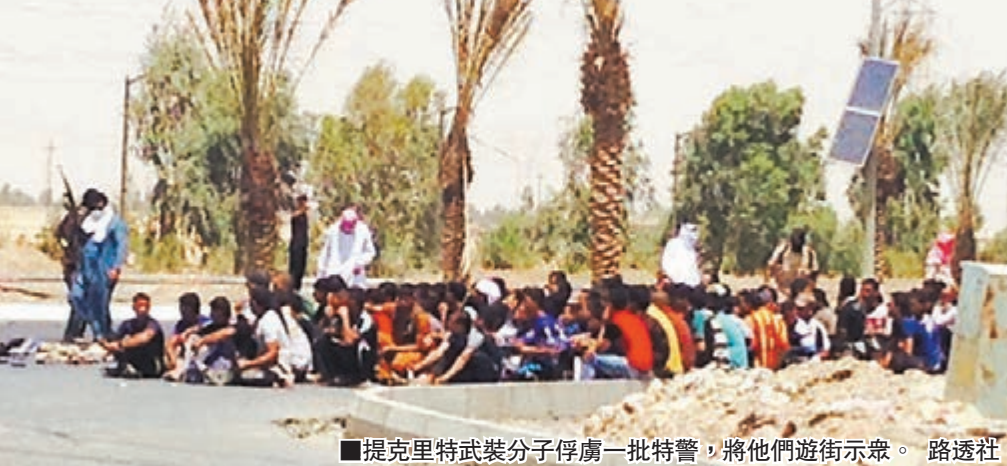
■提克里特武裝分子俘虜一批特警，將他們遊街示眾。