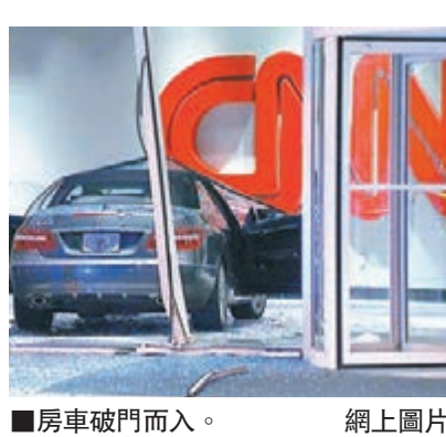
■房車破門而入。

美國有線新聞網絡(CNN)於亞特蘭大的總部，昨清晨被一輛載有1男1女的灰色平治房車撞毀，大堂玻璃外牆破裂，無人受傷。警方指涉案司機承認較早前曾吸食大麻，起訴他醉酒駕駛、危險駕駛及藏有