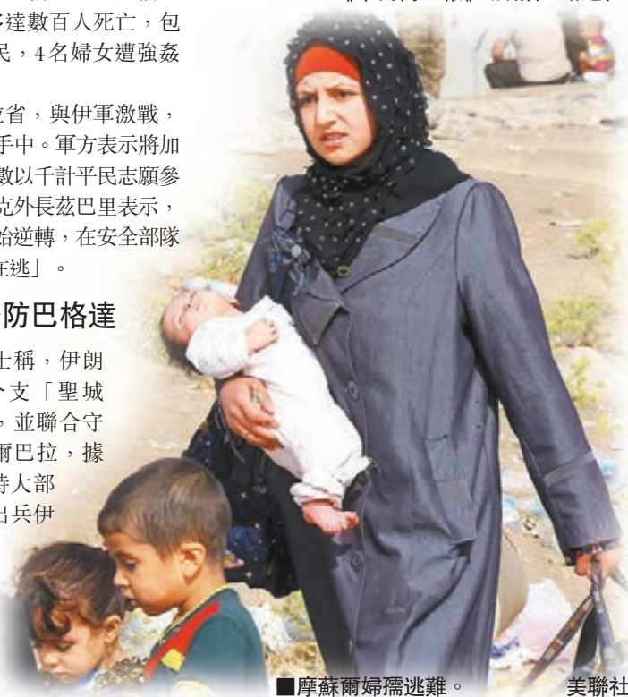
■摩蘇爾婦孺逃難。