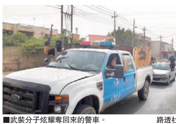
■武裝分子炫耀奪回來的警車。