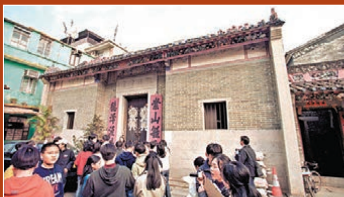
元朗屏山文物徑上的觀廷書室