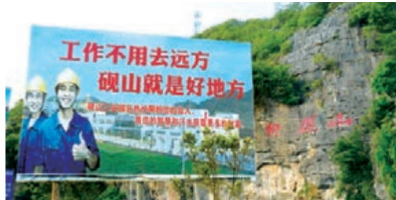
■硯山工業園區招工看板。

在文山開展「兩整一提高」工作中，涉及全州8縣市的礦業企業和私營業主，對於這樣一個牽涉繁複的系統工程而言，由政府主導意味着面臨「服眾」的難題，對此，納傑表示，「陽光是最好的防腐劑」，唯有將所有的流程與工作都在公眾的監督之下完成，才能杜絕礦業整頓工作中的暗箱操作，維持政府的公信力，打消礦業經營者的顧慮。