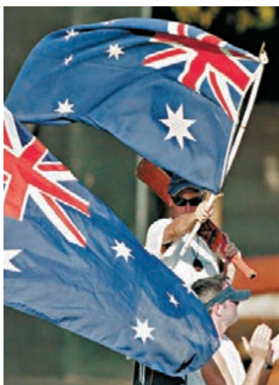
■澳洲將在3年內公決是否修改國旗「米」字圖案。資料圖片

國旗圖案只代表過去歷史，將於3年內就修改國旗一事進行全民公決。澳洲亦有組織提出修改國旗象徵英聯邦成員國身份的「米」字圖案。這些舉動可能引起英國隱憂，故凝聚英聯邦成員力量顯得格外重要。