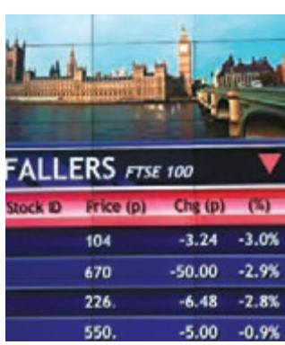
■倫敦是全球三大金融中心之一。圖為倫敦股票交易所。資料圖片

(BBC) 及經濟學人 (The Economist) 等對世界資訊傳播的影響重大。此外，英國古典文學，以及電影如《憨豆先生》系列、《哈利波特》系列、《占士邦》系列等都具國際吸引力。