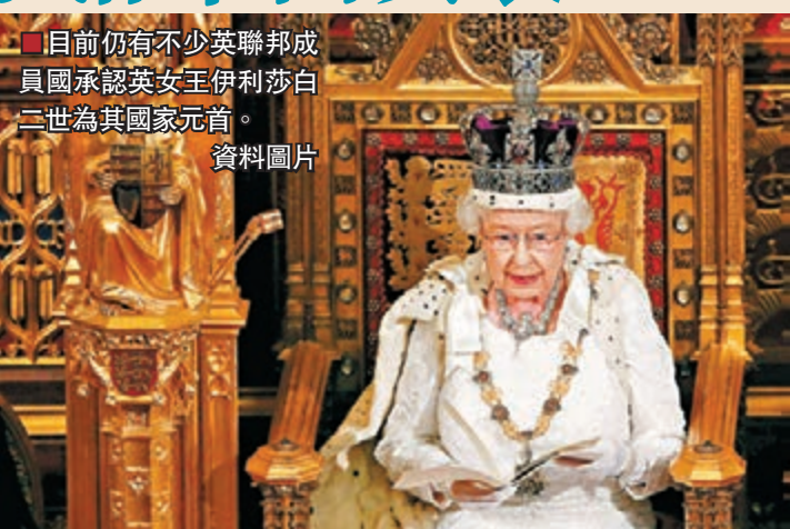
■目前仍有不少英聯邦成員國承認英女王伊利莎白二世為其國家元首。資料圖片

起及英國國力的日漸式微，其殖民地紛紛獨立。後來，英國與大部分前殖民地國家組成一個國際性組織——英聯邦，維持英國對世界各國事務的影響力。獨立後的英殖民地大部分都進入英聯邦。1997年，香港回歸中國後，英國還有14塊海外領土，以及有16個英聯邦成員國承認英女王伊利莎白二世為其國家元首。但與大英帝國不同，英國在英聯邦制度下，再沒法在政治、外交及經濟等方面直接影響成員國。