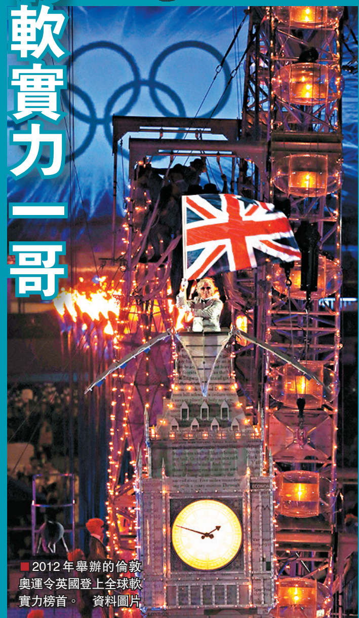
■2012年舉行的倫敦奧運令英國登上全球軟實力榜首。資料圖片