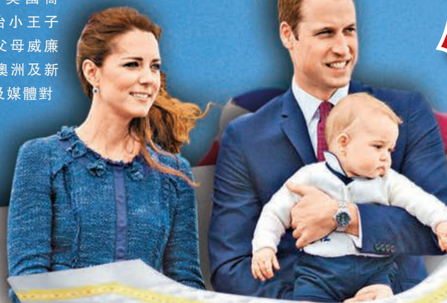
■小王子跟隨父母威廉王子和凱特王妃展開「尿布外交」訪問。資料圖片

今年4月穿着尿布隨父母威廉王子和凱特王妃出訪澳洲及新西蘭18天。英國王室及媒體對喬治小王子寄予厚望，期待他能塑造王室民主親和的形象，以軟實力來鞏固英聯邦國家的團結。這次出訪更被媒體稱為「尿布外交」。到底何謂軟實力？其在國際政治中又扮演甚麼重要角色？現今的英國如何全球政治？下文將會逐一探討。 ■丁天悅