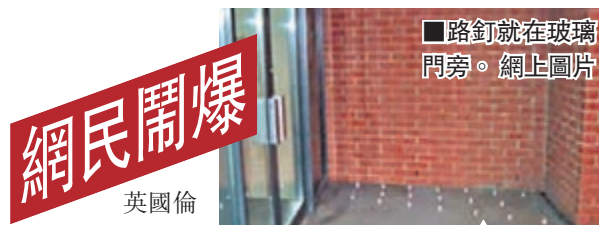
路釘就在玻璃門旁。