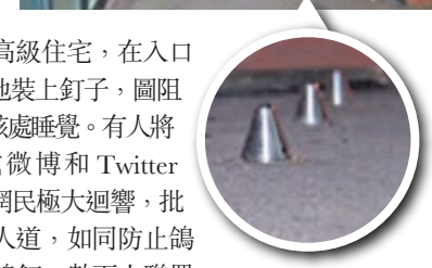
路釘雖不算鋒利，但若不小心跌倒撞上了，傷勢必定不輕。網上圖片

該住宅兩周前在大門側增設19顆高5厘米的鈍釘，但事前並無知會住客。住客對措施意見不一，有人認為太殘忍，指釘子把人當鴿子般驅趕，不過支持的住客則指常有醉酒露宿者在門前留宿，令女士不敢夜歸；亦有人指這些只是鈍釘，露宿者只需在上面鋪一張毯，便可照睡。