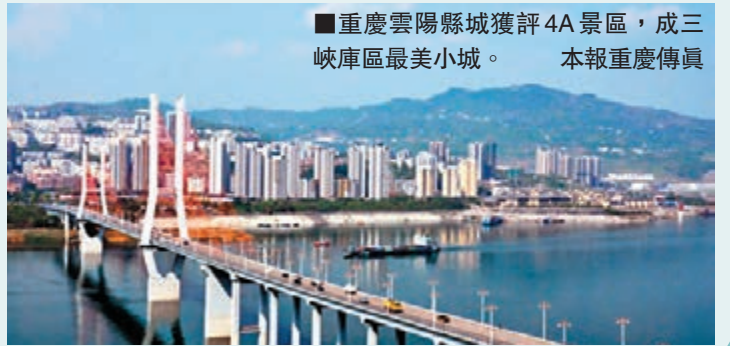
重慶雲陽縣城獲評4A景區,成三峽庫區最美小城。本報重慶傳真

香港文匯報訊(記者 楊毅 重慶報道)記者日前從重慶雲陽縣獲悉,雲陽縣城整體(三峽梯城)被內地旅遊景區質量等級評定委員會評定為國家4A級景區。至此,雲陽擁有4A級景區的數量已達到3個,不僅成為全市擁有高等級景區最多的區縣,同時也成為三峽庫區9個全淹全遷縣裡最美的一座城。 據了解,為使新城居民擁有一個良好的居住環境,早在三峽移民舊縣城搬遷之前,重慶雲陽對新城進行了規劃和設計,並修建了磐石城、三峽文物園、登雲梯及龍脊嶺公園等眾多各具特色的建築。同時,城區有自然、歷史、人文、景觀18處之多,花、樹、石、梯、樓相得益彰,交相輝映,是休閒、度假的絕佳之地。