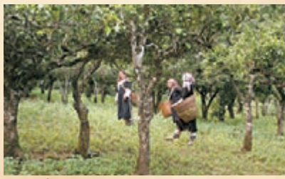
臨滄百年以上人工栽培型古茶園。

香港文匯報訊(記者 李守清 昆明報道)本月6日至今日(10日),第二屆中國—南亞博覽會暨第二十二屆昆明進出口商品交易會舉辦期間,臨滄市借助南博會的廣闊平台,共簽約項目50個,涉及文化旅遊、加工製造、商貿物流等多個合作領域。 據了解,南博會是雲南與東南亞、南亞等周邊國家和環印度洋地區的重要合作交流平台,也是集商品交易、服務貿易、投資合作和文化交流於一體的高級商會。臨滄市招商引資專場推介暨項目簽約儀式上,臨滄簽下雙江冰島旅遊園開發建設項目、取馬跨境旅遊開發項目、臨翔區螞蟻堆大型農產品交易中心建設項目等50個項目,協議投資503.6億元,成為南博會首日的最大亮點。