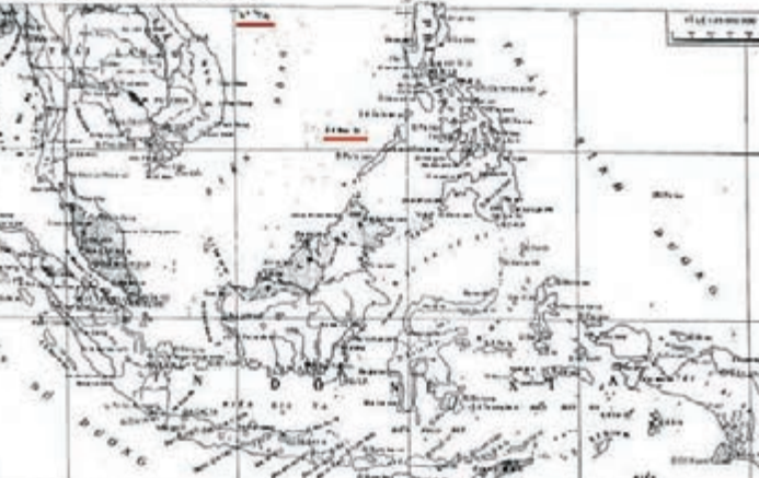
■1972年5月越南總理府測量和繪圖局印製的《世界地圖集》，用中國名稱標注西沙群島和南沙群島(名稱下畫有紅線)。