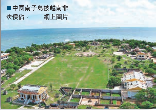
■中國南子島被越南非法佔領。

南子島是中國南沙的第六大島，為中國固有領土。1970年，菲律賓開始向南沙幾個群島秘密出兵。第二年，南子島和北子島都落入菲律賓之手。不過，1975年初，南越通過一場秘密行動，誘惑菲律賓在南子島的駐軍棄守，從而佔領了南子島。