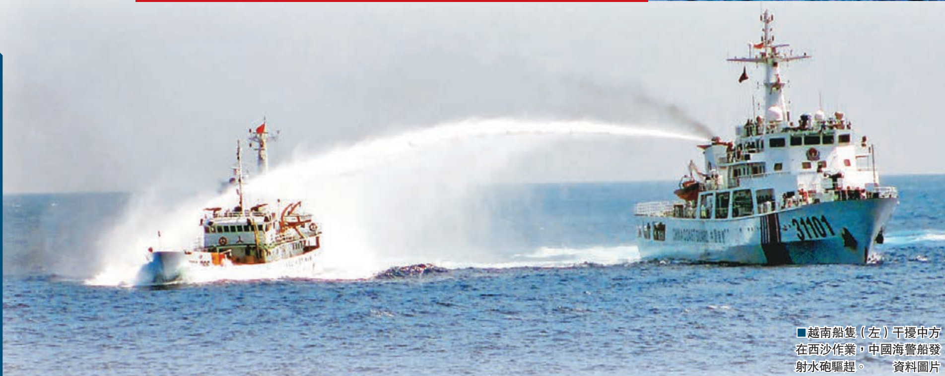
越南船隻(左)干擾中方在西沙作業，中國海警船發射水砲驅趕。資料圖片

香港文匯報訊 中國外交部網站8日在頭條位置顯著推出《「981」鑽井平台作業：越南的挑釁和中國的立場》長篇文章及多份附件。文章表示，西沙群島是中國固有領土，不存在任何爭議。而從今年5月2日中國「981」鑽井平台在中國西沙群島毗連區內開展作業至本月7日，越方船隻闖入中方警戒區及衝撞中方公務船累計達1,416艘次。「中方規勸越方從維護兩國關係和南海和平穩定大局出發，緩和緊張局勢，使海上盡快恢復平靜。」