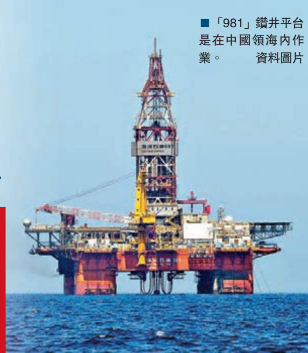
「981」鑽井平台是在中國領海內作業。資料圖片

香港文匯報訊 中國外交部網站8日在頭條位置顯著推出《「981」鑽井平台作業：越南的挑釁和中國的立場》長篇文章及多份附件。文章表示，西沙群島是中國固有領土，不存在任何爭議。而從今年5月2日中國「981」鑽井平台在中國西沙群島毗連區內開展作業至本月7日，越方船隻闖入中方警戒區及衝撞中方公務船累計達1,416艘次。「中方規勸越方從維護兩國關係和南海和平穩定大局出發，緩和緊張局勢，使海上盡快恢復平靜。」