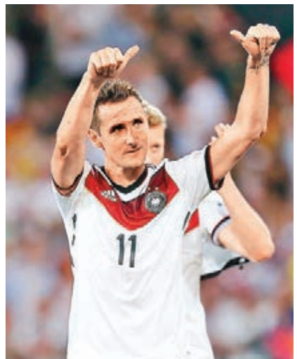
高路斯成為德國隊歷史神射手。

同日在美國進行的熱身賽，葡萄牙缺C·朗拿度下憑中堅般奴艾維斯補時頂入，贏墨西哥1：0；日本由大久保嘉人補時絕殺反勝贊比亞4：3，香川真司有進帳，本田圭佑更入兩球。