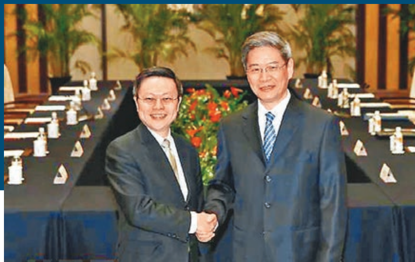
■國台辦主任張志軍(右)今年2月11日在南京與台灣陸委會主委王郁琦首次正式會面。

香港文匯報訊 自大陸官媒發文暗示國台辦主任張志軍即將首次訪台後，台灣媒體昨日更進一步透露，張志軍最快可於本月下旬訪台，並稱台灣朝野對「張王二會」已達共識，「大陸以往例會在六月中旬海峽論壇提出對台政策利多，屆時將是張回訪台灣的最佳時機。」對此，國台辦發言人范麗青昨日並沒有直接回應此事，只強調大陸方面希望台灣各黨派人士都積極支持兩岸之間的交流與合作，推動兩岸關係和平發展。