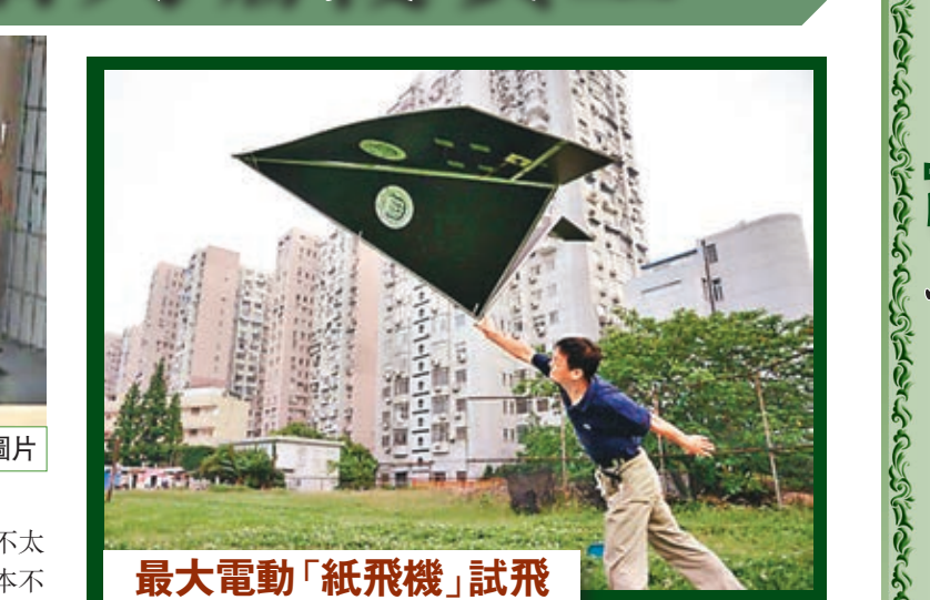
最大電動「紙飛機」試飛

翼展3米、身長3米、重2.5克，一架號稱世界上最大的遙控電動「紙飛機」，近日在上海同濟大學升空，進行了60米直線飛行，成功試飛。「紙飛機」材質為新型泡沫板，不僅升降自如，還能做翻滾動作，高難度的高空試飛不久會在上海F1賽車場進行。