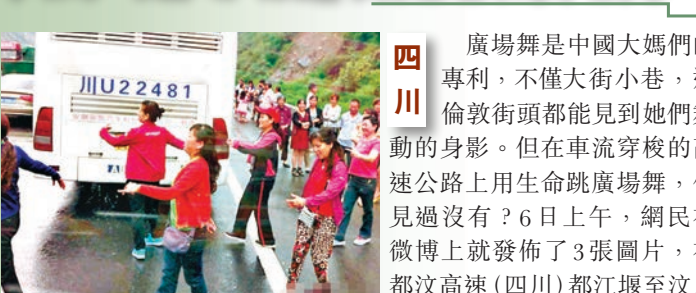
■大媽在高速跳廣場舞被批走火入魔。

四川 廣場舞是中國大媽們的專利，不僅大街小巷，連倫敦街頭都能見到她們舞動的身影。但在車流穿梭的高速公路上用生命跳廣場舞，你見過沒有？6日上午，網民在微博上就發佈了3張圖片，在都汶高速(四川)都江堰至汶川方向遇到堵車後，5名大媽為打發時間，索性在高速公路上跳起了廣場舞。