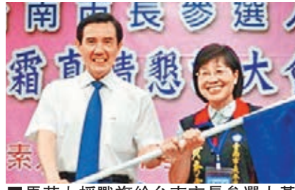
■馬英九授旗給台南市長參選人黃秀霜。

是只以養活2,300萬人就可過關；台灣的產值遠超過島內需要，可外銷到海外創造更多財富。「開放帶來希望、閉鎖必然萎縮」，台灣未來面對的競爭不只是在島內，而是在全世界。他希望所有同學在畢業之後要勇敢走向國際。