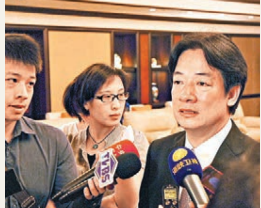
■賴清德在上海復旦大學進行座談時提及兩岸關係需在互信交流中推動。

香港文匯報訊(記者 沈夢珊 上海報導)台南市長賴清德昨晚結束上海的兩日行程返回台灣。昨日他前往上海復旦大學與師生座談交流時表示，兩岸關係在通過彼此尊重、互信穩健中交流推進，自然會水到渠成。