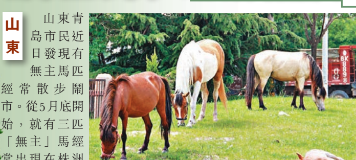
■馬匹在青島街頭草坪吃草休息。

山東 青島市民近日發現有無主馬匹經常散步鬧市。從5月底開始，就有三匹「無主」馬經常出現在株洲路與深圳路交界處，在路邊草坪吃草、散步、曬太陽，馬背上並無馬鞍、馬鐙等馬具。每天在太陽落山時分，馬匹又會沿海爾路向北準時「回家」。