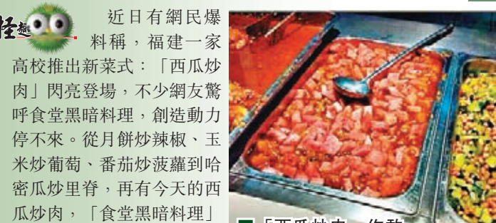
■「西瓜炒肉」你敢試下嗎？

近日有網民爆料稱，福建一家高校推出新菜式：「西瓜炒肉」閃亮登場，不少網友驚呼食堂黑暗料理，創造動力停不來。從月餅炒辣椒、玉米炒葡萄、番茄炒菠蘿到哈密瓜炒肉，再有今天的西瓜炒肉，「食堂黑暗料理」一直創新中。