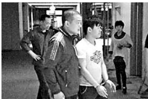
■幼童色情網站疑犯落網。網上圖片

經調查,截至5月13日,該網站會員有90,380人,發帖總量達44,766條。其中淫穢視頻164部,淫穢圖片11,137張,均涉及幼女或