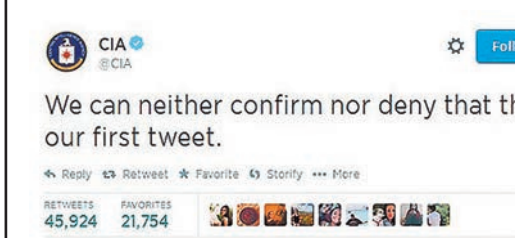
中情局在 twitter 第一條留言。網上圖片

美國中情局(CIA)向來「神龍見首不見尾」，前日突然一改作風，正式開通 twitter 及社交網絡 facebook 帳戶，但首則留言仍貫徹其神秘風格，稱「我們無法證實或否認這是我們第一條留言」。這留言立即引起民眾興趣，一個半小時內吸引9萬人轉發及11.5萬人跟隨。