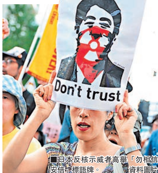
日本反核示威者高舉「勿相信安倍政權」標語牌。資料圖片

今次漏報牽涉九州電力公司玄海核電站三號機組內燃料所含的640公斤鈾，這些燃料2011年3月投入反應堆，但因福島核事故後反應堆停用，而長期擱置。當局去年3月才將未使用的燃料從反應堆取出，至今仍存放在燃料池內，屬於IAEA的查核對象。 ■共同社