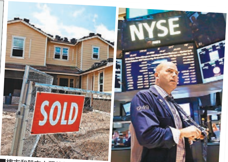
樓市和股市上漲的得益落入富裕階層口袋，造成富者愈富。資料圖片