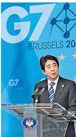
莫迪或下月訪日，會晤安倍晉三。

相比下月有機會出訪日本，莫迪的美國之行可能要等到9月。他與美國的關係存在隱憂，因為2002年莫迪管治的古吉拉特邦曾反穆斯林暴動，事後美國批評莫迪偏袒印度教暴徒，一度向他發出入境禁令。美國國務院澄清，莫迪作為政府首腦將獲發特別簽證，無阻他到訪美國，但分析認為此事會令莫迪和華府心存芥蒂，影響兩國未來關係。