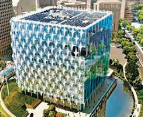
美駐倫敦新大使館工程超支最少1億美元。

駐外大使館和領事館代表一國形象，各國對有關建築要求高一點很平常，不過華府被揭要求特別高，如外觀要夠華麗、具能源效益，為此花掉數億美元的公帑，更令有關職員遲遲未能搬入新