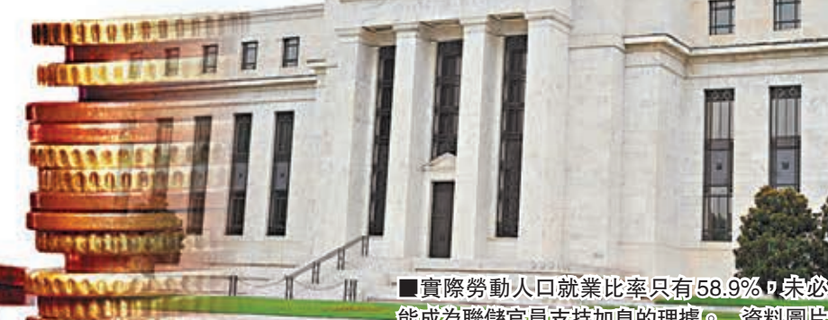
實際勞動人口就業比率只有58.9%，未必能成為聯儲官員支持加息的理據。資料圖片