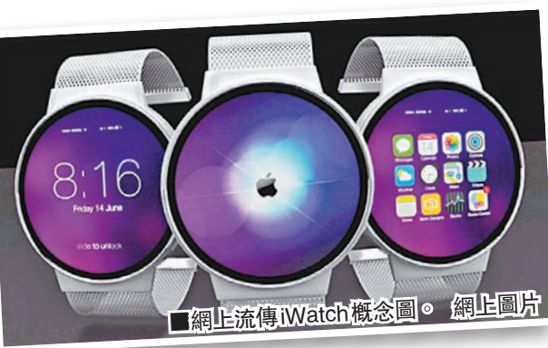
網上流傳iWatch概念圖。

有最新消息指，一直「只聞樓梯響」的蘋果智能手錶iWatch預定在10月發布，盛傳錶面將會採取圓形設計，並設有男性和女性尺寸。 美國有線新聞網絡/《每日郵報》