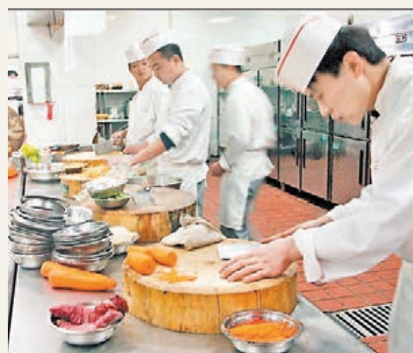
新西蘭對中餐廚師工作簽證限額為200名。網上圖片

香港文匯報訊 新西蘭移民局近日開放中國特殊工作簽證申請通道，向達到要求的中餐廚師、中醫醫師、漢語助教、武術教練和導遊提供最長可達3年的工作簽證。