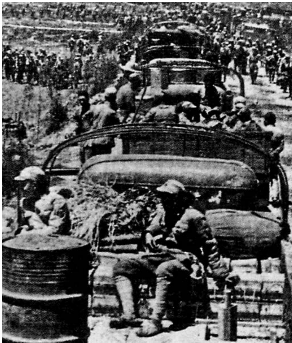
1942年初開赴緬甸作戰的中國遠征軍。

從中國軍隊入緬算起，中緬印對日作戰歷時3年零3個月，中國投入兵力總計40萬人，傷亡過半，無數英雄長眠在中緬邊境的莽莽群山中。