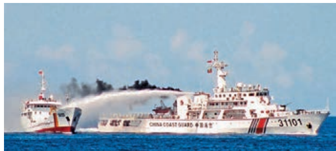
中國公安船射水炮驅逐干擾中方海上平台作業的越南船隻。

香港文匯報訊 越南駐聯合國代表團團長黎淮忠6日向聯合國秘書長潘基文致信，並隨附了越南外交部致中國外交部的公函，反對中國在南海西沙海域架設海洋石油981鑽井平台和部署船艦為其護航的「違法行為」。