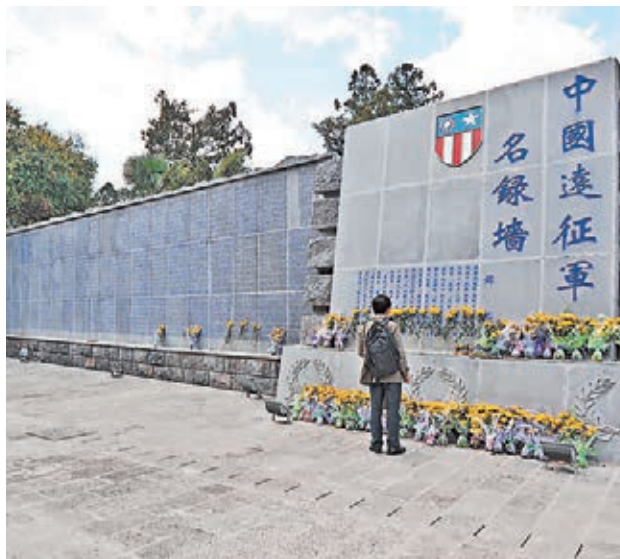
騰沖國殤墓園內的中國遠征軍名錄牆。