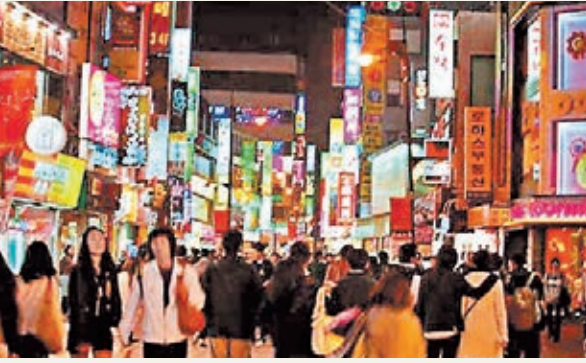
若首爾對中國免簽，中國公民往首爾旅遊更便利。圖為首爾的明洞商業區。

香港文匯報訊 韓國駐成都總領事館總領事安成國透露，繼濟州島之後，首爾也將可能對中國開放免簽，還將可能在重慶設立簽證中心，方便重慶市民辦理赴韓簽證。