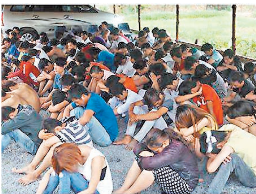
打砸搶燒暴力事件發生後，越南平陽公安抓獲1000多人。

胡志明市公安稱，在過去的時間裡，警察破獲了許多危險的犯罪團伙，並迅速破獲了許多殺人、搶劫、綁架兒童案件，公安部門還說，在未來一段時間內，犯罪形勢仍會複雜。一些殺人、傷人、搶劫事件仍會時有發生，且罪犯年齡越來越年輕。中國外交部發言人洪磊日前表示，越南仍沒有提供任何賠償，「我們要求越南切實保障在越南的中國機構和個人的安全，嚴厲處罰製造暴亂的襲擊者，並全部賠償中國企業和個人的損失。」