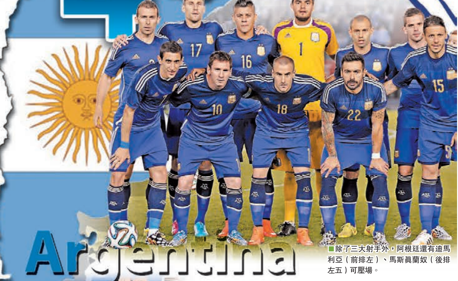
阿根廷首都布宜諾斯艾利斯的美斯像揭幕。

美斯的潛力能否得到最大限度發揮無疑是阿根廷奪冠的關鍵，一職多能的他既能衝鋒陷陣又能回後組織中場。對於過去兩屆世盃只入1球而備受質疑的美斯而言，巴西世盃是他「封神」的關鍵戰場。阿根廷人今次籤運確實不錯，同實力相對較弱的尼日利亞、波斯尼亞和伊朗同處F組，加上在南美洲出戰，可謂佔盡天時地利人和，大有機會殺入4強。