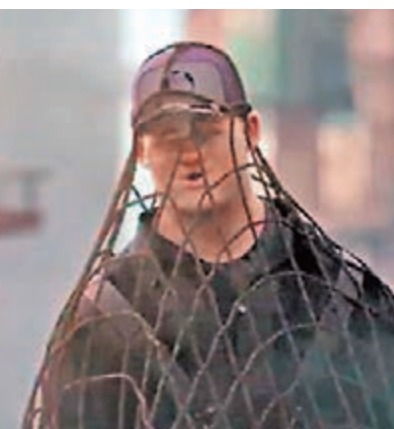
卡通明尼成網中人。