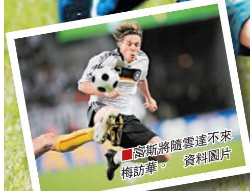
高斯將隨雲達不來梅訪華。 資料圖片

據了解，雲達不來梅此次中國之行共有49人。其中，曾參加南非世界盃的前荷蘭國腳艾利亞、前德國國腳富斯等球星為中國球迷所熟悉。