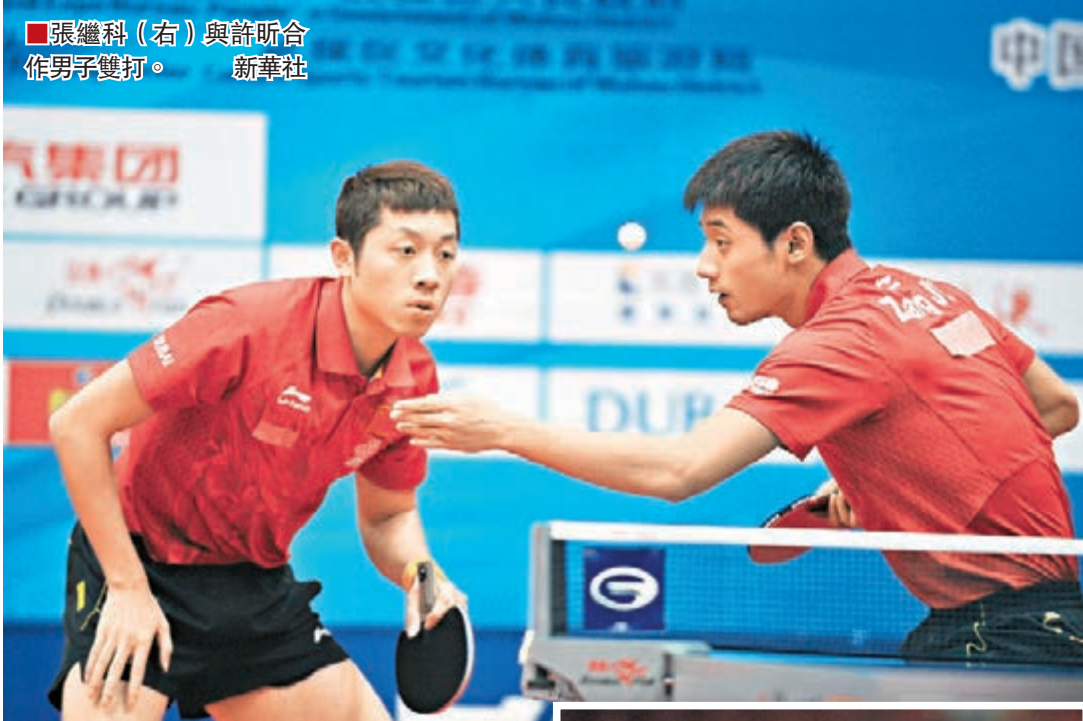
張繼科(右)與許昕合作男子雙打。

中新社成都6日電 國際乒聯世界巡迴賽——2014年中國乒乓球公開賽開幕式6日在四川成都舉行，共有包括王皓、張繼科、李曉霞、莊智淵、水谷隼、馮天薇等國際知名選手在內的16個國家和地區的144名運動員參賽。此次公開賽是2014年唯一在中國舉辦的世界巡迴賽，比賽獎金高達23萬美元，同時也是奧運積分賽。比賽設男子單打、女子單打、男子雙打、女子雙打和21歲以下男、女單打共6個項目。本次比賽中，主場作戰的中國乒乓球隊派出了全部主力陣容參賽，男單許昕、馬龍、張繼科、王皓、閔安和樊振東征戰，女單劉詩雯、丁寧、李曉霞、陳夢、朱雨玲和武楊參賽，男雙和女雙各有三對和兩對組合出戰。許昕作為男單頭號種子坐鎮上半區，首輪面對奧地利的馮曉泉，閔安與張繼科也在上半區，兩人第二輪的對手分別是中國香港的唐鵬和日本的松平健太。劉詩雯以女單頭號種子身份參賽，與李曉霞、朱雨玲同在上半區，目前劉詩雯和朱雨玲兩人都備戰里約奧運會的重點隊員，兩人之間的每一次直接對決都很有可能對奧運前景產生影響。「比賽結果還是順其自然。」朱雨玲在賽前表示，在自家門口作戰，暫時還沒想取得甚麼樣的成績，只要發揮出自己的水平就行。大滿貫得主張繼科則表示，此次比賽中，他希望與許昕組成的全新男子雙打組合能有所突破。中國乒乓球公開賽在6月4日和5日進行了資格賽爭奪，6日至8日展開正賽較量。