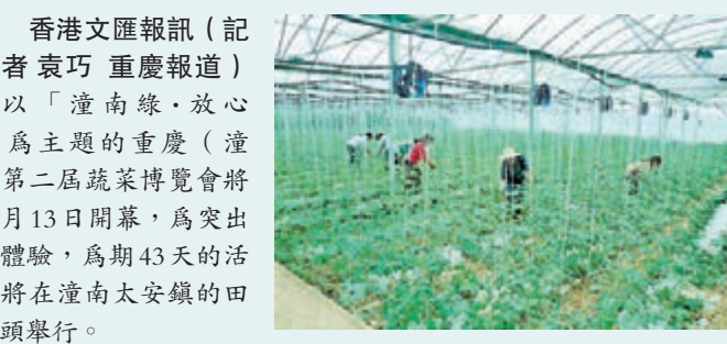
潼南太安灌渠蔬菜基地。本報重慶傳真

香港文匯報訊(記者 袁巧 重慶報導)以「潼南綠·放心菜」為主題的重慶(潼南)第二屆蔬菜博覽會將於本月13日開幕,為突出農耕體驗,為期43天的活動都將在潼南太安鎮的田間地頭舉行。