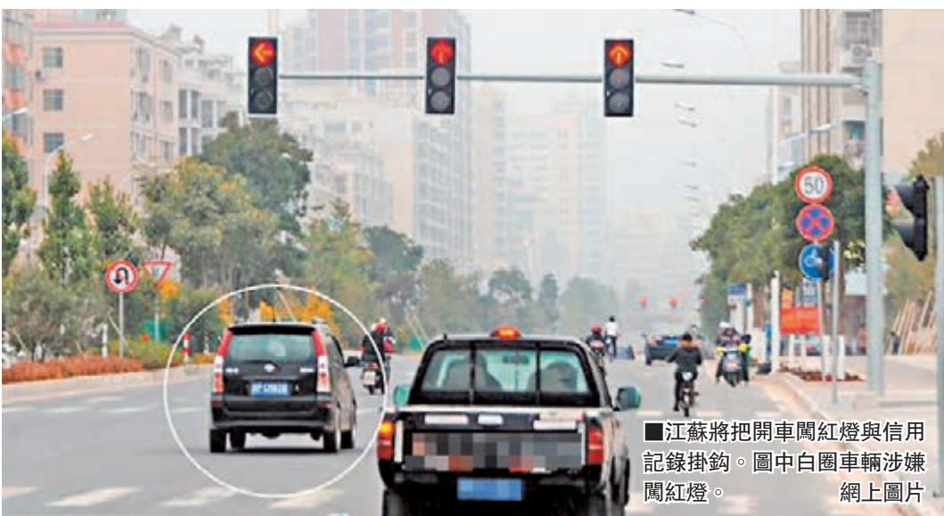
江蘇將把開車闖紅燈與信用記錄掛鉤。圖中白圈車輛涉嫌闖紅燈。網上圖片

香港文匯報訊(記者 趙勇 江蘇南京報導)江蘇省公安廳日前發佈公告稱,將把開車闖紅燈等交通違法行為列入個人失信記錄,違法司機不僅面臨警方的處罰,還在就業、貸款、投保等方面受到連帶懲罰。目前,這一交通信用管理辦法正在徵求社會公眾意見,至本月23日徵求意見截止後,這一管理辦法就將擇日實施。據了解,將交通違法行為與個人信用掛鉤,並明確懲戒措施,這樣的管理措施在內地還是首次出現。