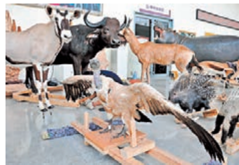
青島世界動物標本藝術館內的動物標本。本報山東傳真

香港文匯報訊(記者 王宇軒,通訊員 劉志剛 青島報導)青島濱海學院動物標本藝術館日前新進51件南非動物標本,本月佈局完畢,藝術館也將以嶄新姿態亮相,猶如青島版的「博物館奇妙夜」。據了解,這51件標本是第二批入駐該院的非洲動物標本,目前,全館動物標本已達千餘件,為山東省最大的大型動物標本館。