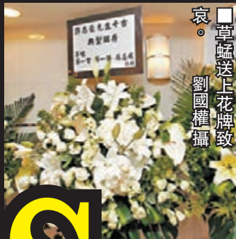
草草送上花牌致哀。