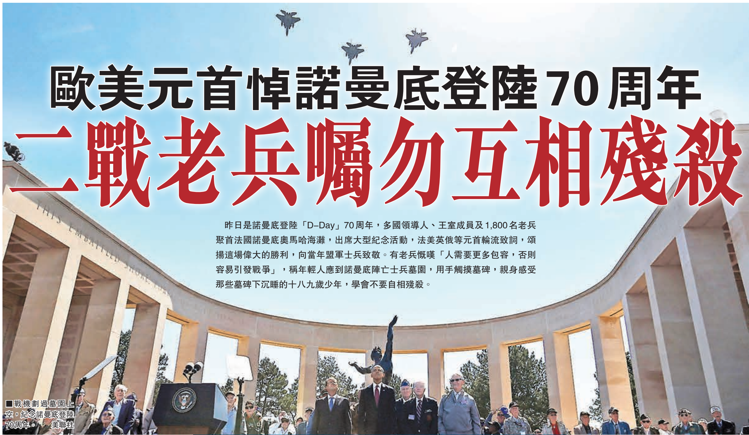
戰機劃過墓園上空，紀念諾曼底登陸70周年。

昨日是諾曼底登陸「D-Day」70周年，多國領導人、王室成員及1,800名老兵聚首法國諾曼底奧馬哈海灘，出席大型紀念活動，法美英俄等元首輪流致詞，頌揚這場偉大的勝利，向當年盟軍士兵致敬。有老兵慨嘆「人需要更多包容，否則容易引發戰爭」，稱年輕人應到諾曼底陣亡士兵墓園，用手觸摸墓碑，親身感受那些墓碑下沉睡的十八九歲少年，學會不要自相殘殺。