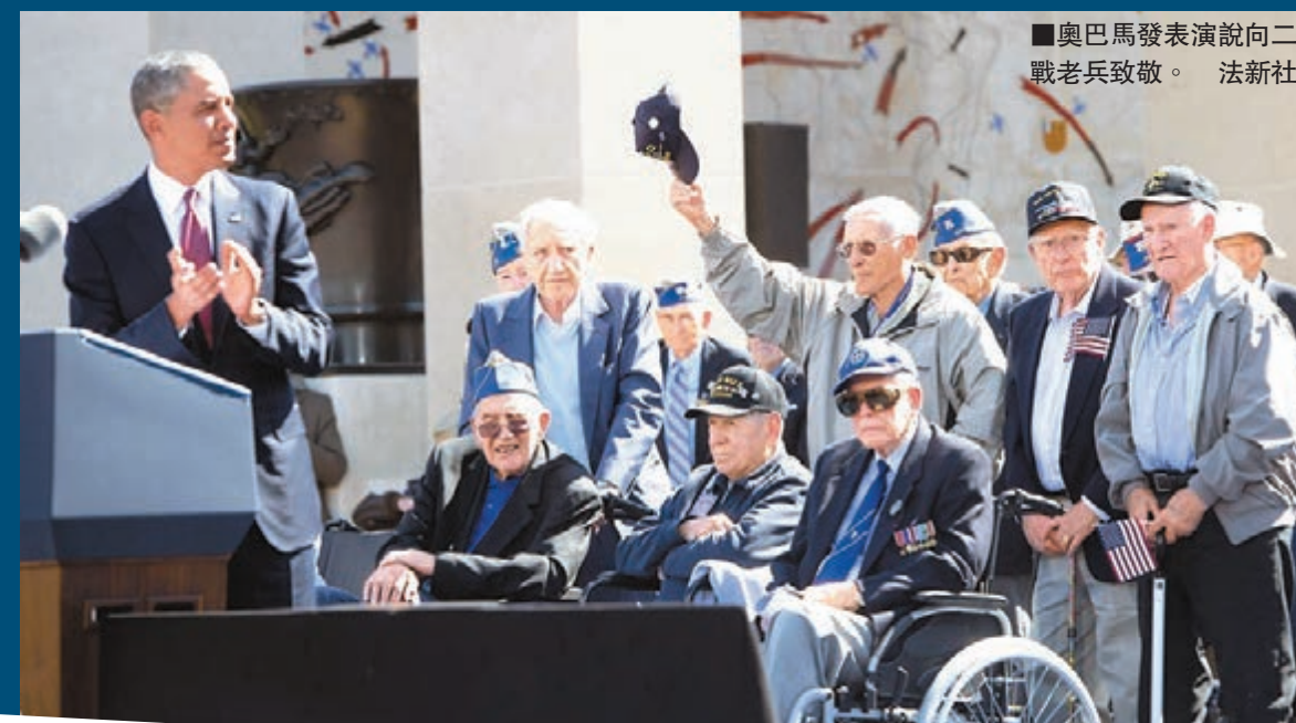
奧巴馬發表演說向二戰老兵致敬。

曾參與登陸的二戰軍人，現在不少都年屆90歲，今次或是他們最後一次重回舊地悼念同袍。92歲美國老兵羅厄直言，他們是最後一批講述當年實況的「記者」，認為憶述和反思事件很重要。 ■《溫哥華太陽報》/哥倫比亞廣播公司