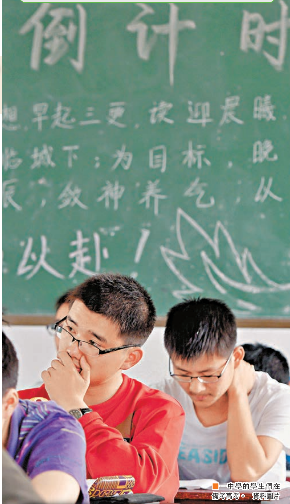
■中學的學生們在備考高考。 資料圖片