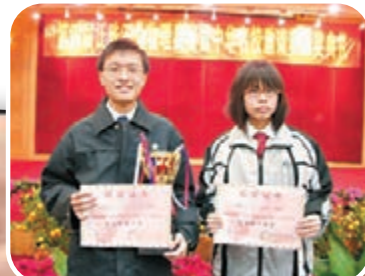
■在奧林匹克競賽中獲獎亦是高考加分的項目之一。 資料圖片