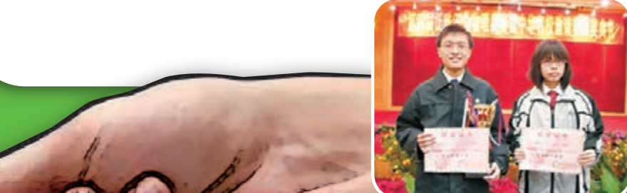
■在奧林匹克競賽中獲獎亦是高考加分的項目之一。 資料圖片

提高其分數。高考加分政策作為其中一個途徑，自然產生一些問題。就此，國家若然繼續實行高考加分政策，自然要推出更多方法以加強監察，減少問題發生的機會。同時，它應考慮在高考以外，如何營造更多向上流動的途徑。畢竟考試制度把一個人的能力簡化為分數，也有一定缺點。