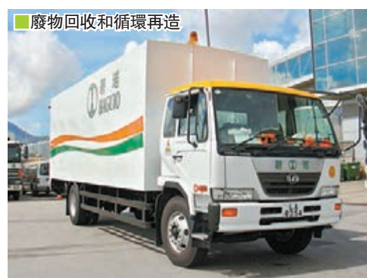
廢物回收和循環再造

「改善環境質素是無止境的，香港從八十年代發展到今天，社會的衛生標準相繼提高，以前只強調