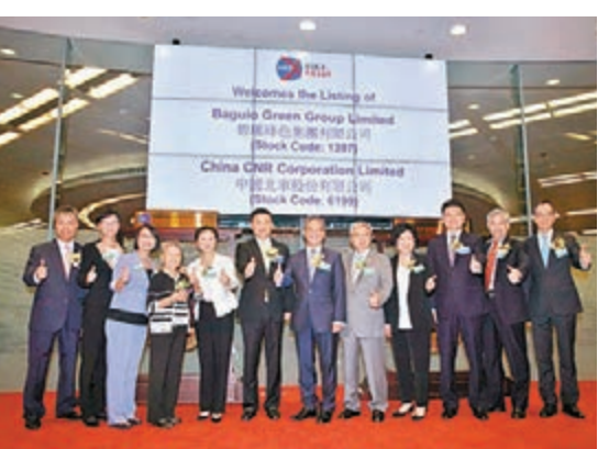
碧瑤綠色集團早前在港招股上市

都市廢物、廚餘、醫療廢物、園藝廢物及化學廢物等，進一步擴充廢物處理及回收服務的業務範疇，同時又通過加強市場滲透擴大現有客戶和私人部門中的市場份額，以積極提高市場佔有率。」