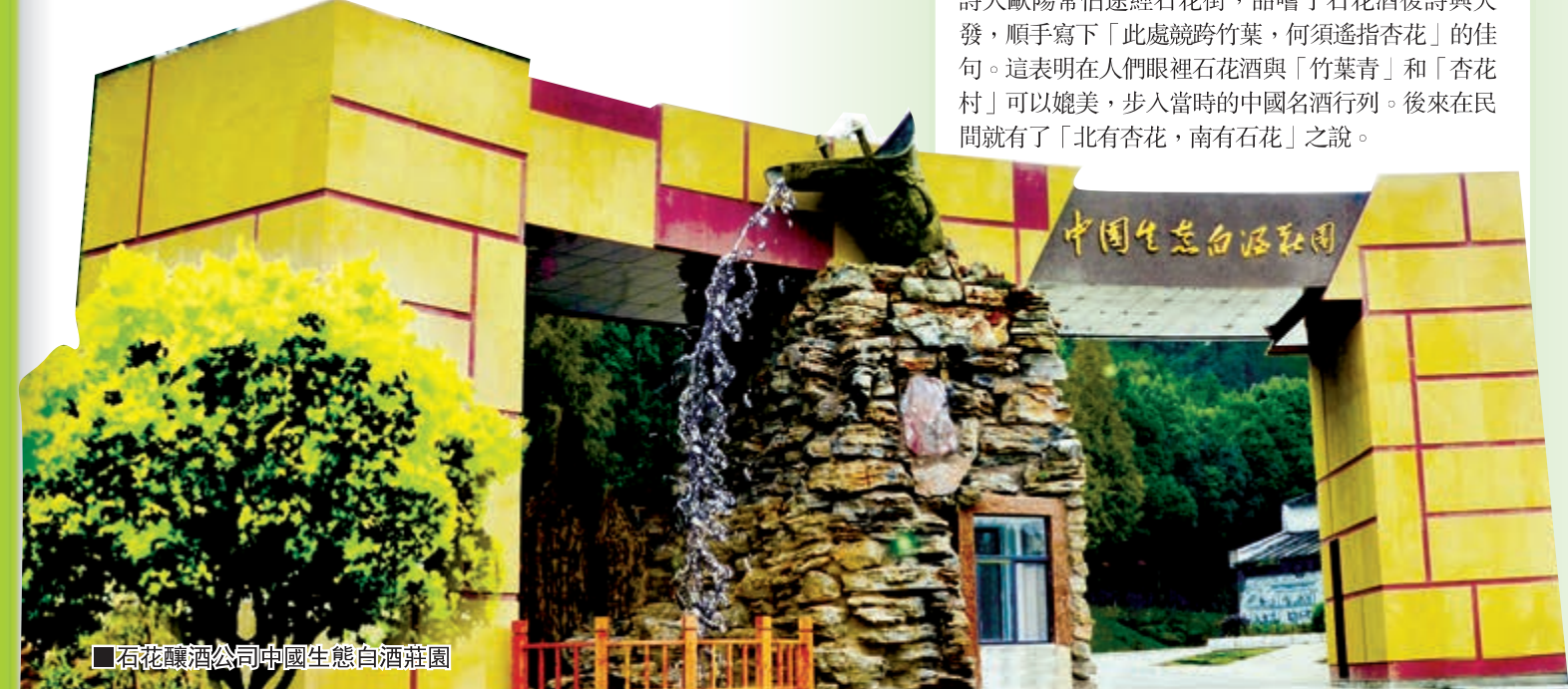
■石花釀酒公司中國生態白酒莊園