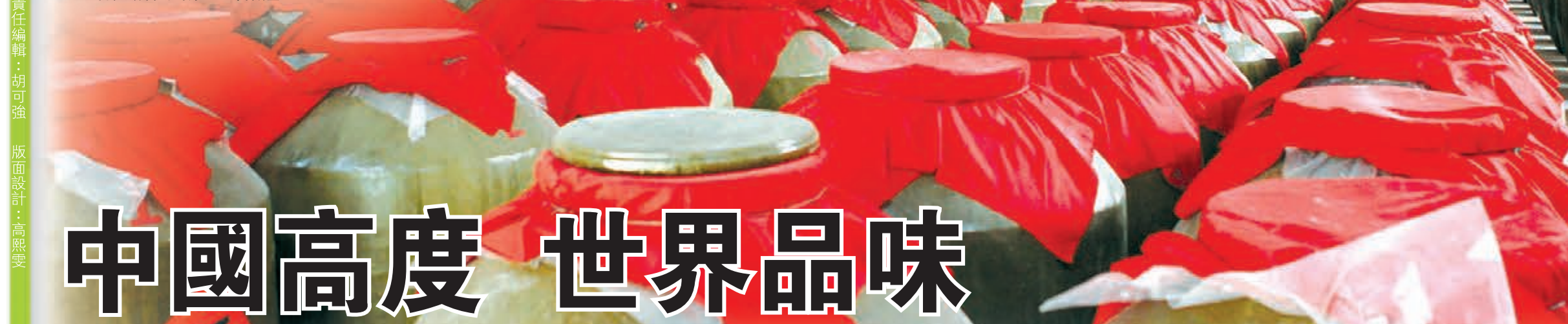
■石花釀酒公司原生態窖藏基地