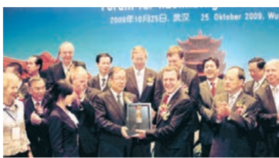
■2009年，時任湖北省省長、現任湖北省書記李鴻忠將珍藏版「石花霸王醉」酒作為「湖北名片」贈送給德國前總理施羅德先生

「這是我們老祖宗留給我們的財富，也是歷史與大自然的恩賜，是不能複製的。霸王醉的質量都來自這些生物菌群是歷史賦予的。」據石花酒業負責人介紹，這些生物菌群經過這麼多年，已經形成特有的自然狀態的環境，很忠誠。歷史文化和地理環境不能複製，離開了石花就不能成就「石花霸王醉」。