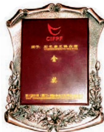
■2005年6月，湖北石花釀酒公司獲第三屆中國（廈門）國際食品交易博覽會「金獎」榮譽

石花酒業利用獨有的「鎮廠之寶、基酒之王」窖藏20年的原酒開發出極品酒「石花霸王醉」，以「中國第一高度、醇而不膩、高而不烈、香而不膩」的獨特質量很快佔領了襄陽乃至湖北的高端酒市場，「石花霸王醉」由此成為「襄陽名片」和「湖北名片」。