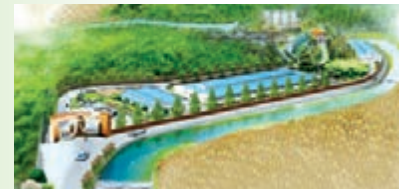
■石花釀酒公司中國生態白酒莊園全景

2008年，全國白酒開始新一輪漲價風潮。霸王醉通過新品開發，形成了科學合理的梯度價格體系，直接將競爭焦點上升到800元至1600元的價格區間。同時，積極宣導少喝、小杯喝的健康飲酒概念，推出了一盒兩支分別為半斤裝的新品「典藏」，並隨盒附送霸王醉專屬酒具，還創造了初嚐霸王醉的「三口喝法」，強調其獨特的飲用體驗感。