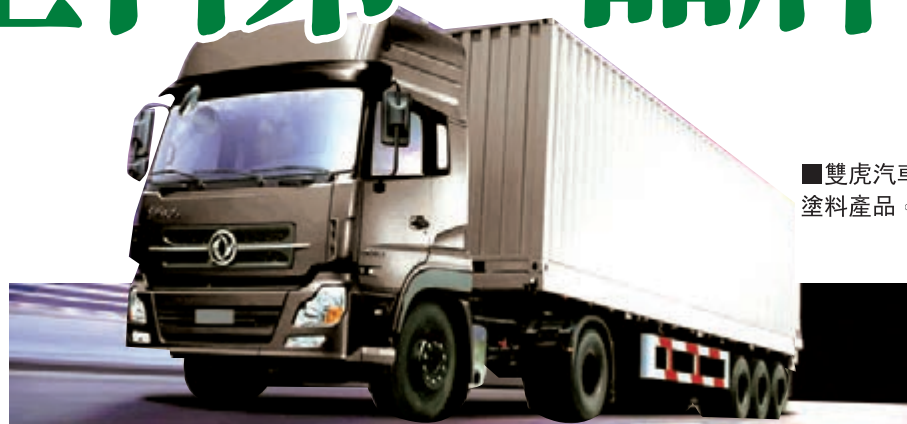
■雙虎汽車塗料產品。

雙虎塗料被國家質檢總局公佈為「全國質量優異產品」，已成為黃鶴樓工程、三峽工程、濟南黃河大橋等重點工程的優質