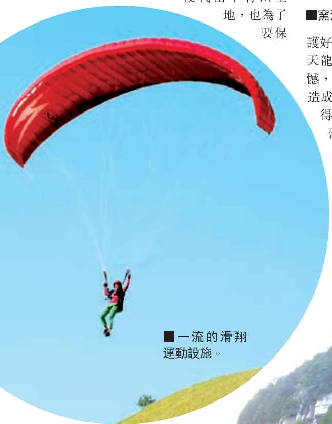
■一流的滑翔運動設施。

馮海忠表示，展望未來，前景無限美好。我們將堅持「保護生態為第一要務」，積極應對各種挑戰，為山西綠色生態建設以及旅遊開發等行業的快速發展和產業的轉型升級做出新的貢獻！