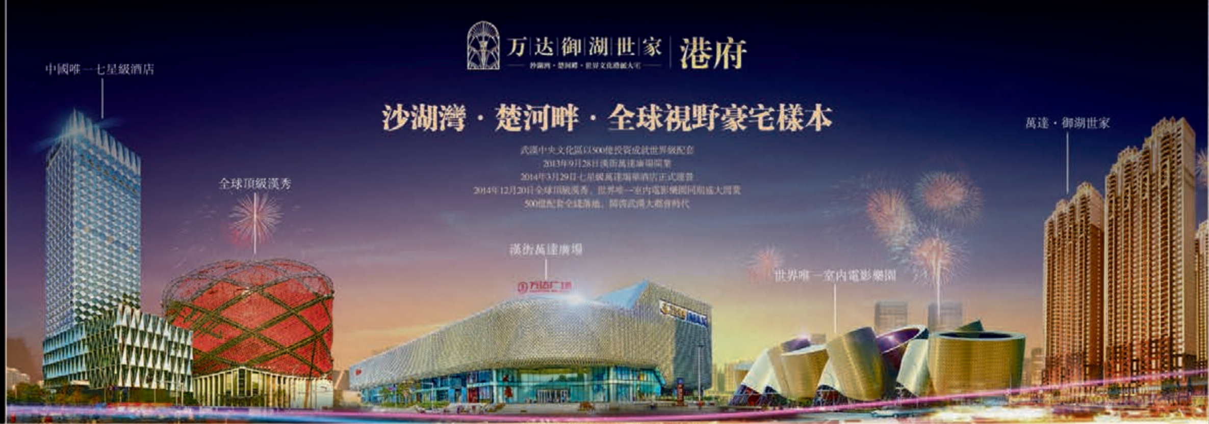
THE FIRST-CLASS BEYOND THE TOP CLASS

武漢中央文化區以500億投資成就世界級配套 2013年9月28日漢街萬達廣場開業 2014年3月29日七星級萬達瑞華酒店正式開幕 2014年12月20日全球頂級漢秀、世界唯一室內電影樂園同期盛大開業 500億投資全建落地，開啓武漢大都會時代