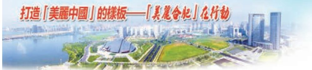
打造「美麗中國」的樣板——「美麗合肥」在行動

三面環山、水系縱橫，良好的生態環境是前人留下的寶貴財富；漫步在鬱金香壟間，徜徉於花海世界，眼前的生態文明是今人創造的開發新區。合肥巢湖經開區堅持走「生態環保立區」和差異化發展之路，用生態之美釋放發展活力，努力構建一個有山皆綠、有水皆清、宜居宜業宜遊的美麗生態開發區。