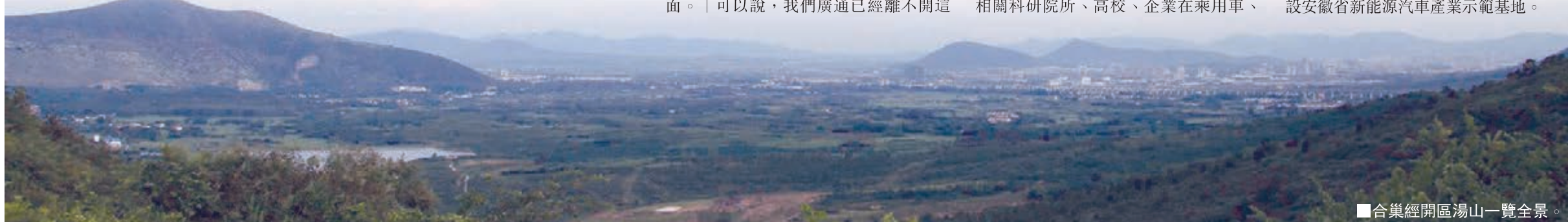
■合巢經開區湯山一覽全景。