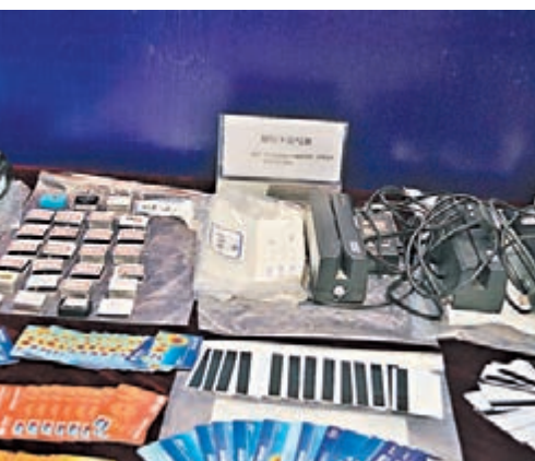
偽銀行卡團夥的作案工具。敖敏輝 攝

據悉,警方從去年10月底發生在東莞的一宗被盜刷71.8萬元案件入手,迅速找到偽卡犯罪核心成員,細細排查,挖出一個以茂名電白籍人為主要成員的龐大犯罪團夥網絡,具體包括6個團夥,涉及50多名犯罪嫌疑人。