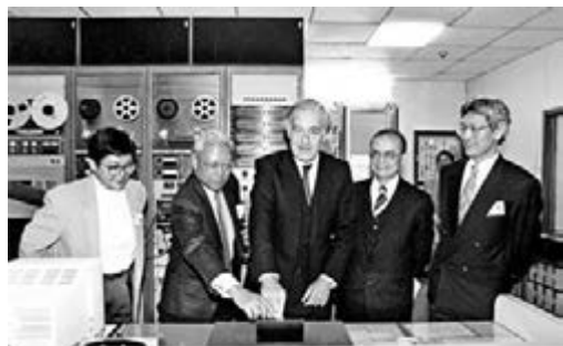
1991年，時任港督衛奕信訪問商業電台，身為當時該台董事總經理何佐芝。資料圖片