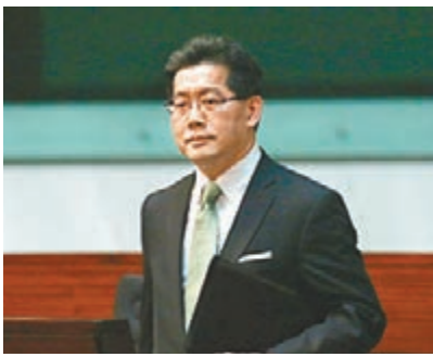
蘇錦樑發表聲明，對何佐芝離世深感惋惜，並表示哀悼。