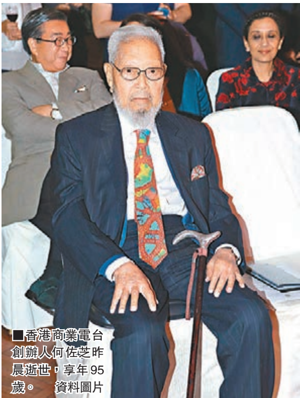
香港商業電台創辦人何佐芝昨晨逝世，享年95歲。資料圖片

過去數十年，商台多次傳出賣盤，但均被他拒絕，商台至今仍由何佐芝家族控制。何佐芝去世前仍是商台名譽主席。5年前商台慶祝50周年，他亦有參與祝酒。