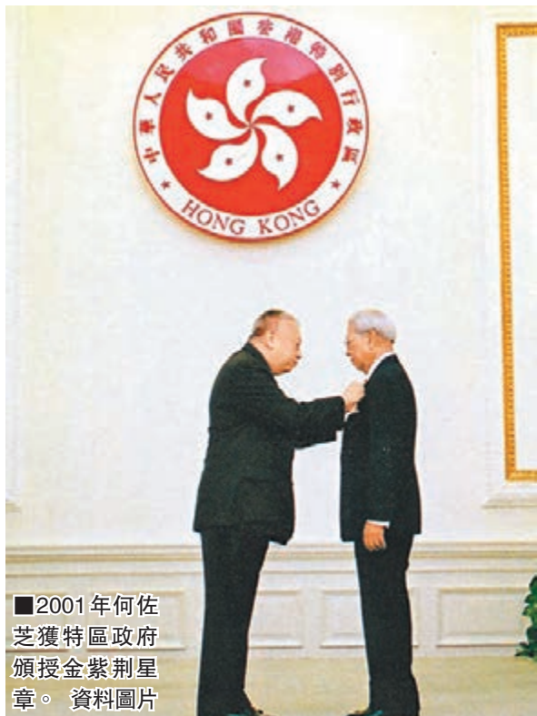
2001年何佐芝獲特區政府頒授金紫荊星章。資料圖片