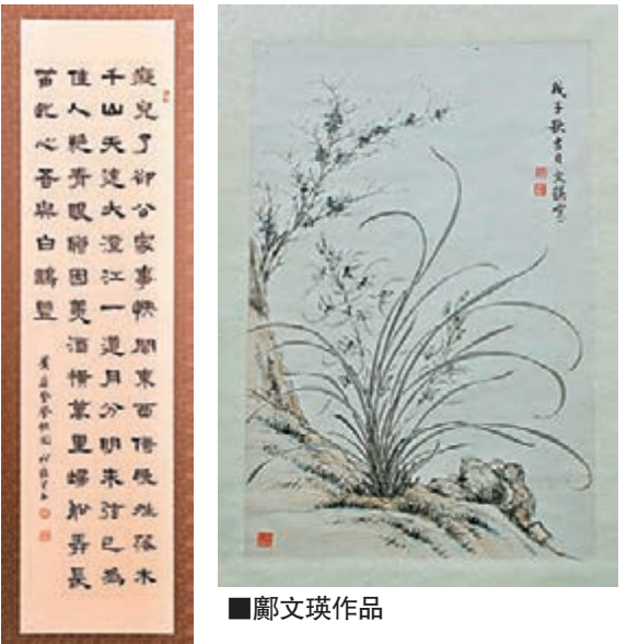
何志郊隸書黃庭堅《登快閣》。