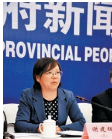
湖南省發改委主任謝建輝強調洞庭湖生態經濟區建設要生態優先。

圍繞再現「八百里洞庭美如畫」規劃設計19項指標,預計到2020年,湖區枯水期生態水域面積恢復到約2,000平方公里,水功能區水質達標率達90%,建成1,500萬畝高標準農田,糧食產量穩定在