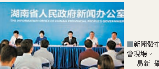
新聞發布會現場。

為推進產業化住宅發展,湖南省出台的《湖南省人民政府關於推進住宅產業化的指導意見》中特別指出,鼓勵湖南省內銀行業金融機構,對符合住宅產業化發展政策的生產企業和開發建設項目,對購買獲得國家康居示範工程項目的住宅和達到綠色建築標準(含國家A級以上住宅性能認定)評價的消費者,優先給予信貸支持,並在貸款額度、貸款期限及貸款利率等方面予以傾斜。