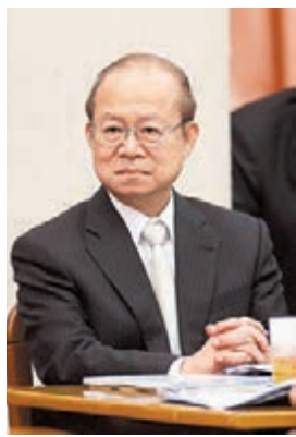
前台灣證券交易所董事長薛琦。

薛琦是當日在廈門大學經濟學科與廈門金園集團聯合主辦的「國際金融大講堂」做演講嘉賓時,作出上述表示。他認為,台灣同時在大陸和東南亞地區有大量的投資,人流、物流、資金流往來密切,尤其是過去30多年來,對大陸貿易進出口一直在快速增長,而且保有大量順差,衍生出對人民幣的大量需求。