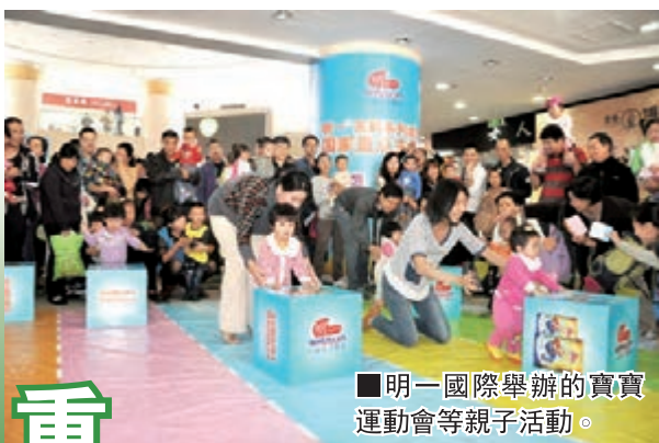
明一國際舉辦的寶寶運動會等親子活動。