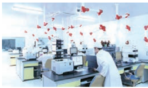
明一國際研發中心實驗室CNAS。

明一奶粉構建了最先進的奶粉質量安全電子信息追溯系統。每一罐明一奶粉在生產過程中都會通過激光打碼技術賦予唯一的可識別身份信息。通過這唯一的可識別身份信息，消費者將可準確查詢到明一奶粉從原料—成品—倉儲—物流—終端的全產業鏈信息，從而確保了明一奶粉的安全真實性，實現了全程監控。確保質量綠色安全可溯源。