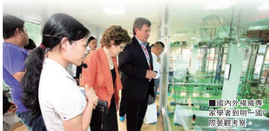
國內外權威專家學者到明一國際參觀考察。

在2014年國家新一輪最嚴格的乳品企業生產許可證審查過程中，明一國際成為內地首家通過審查獲取《生產許可證》的乳品企業。明一國際作為一家富有高度責任感的國際型企業，擁有十大國際領先核心科技、權威科研機構和育嬰專家，集研發、生產、營銷及服務於一體的專業團隊，以「嬰以食為康」的企業責任，和「一切為了孩子」的企業宗旨，始終致力於全球母嬰營養健康事業，在內地擁有完善的營銷網絡系統和眾多忠實的媽媽用戶。