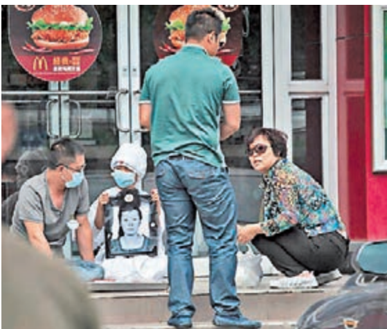
■昨日，死者親屬來到事發麥當勞門前祭奠。