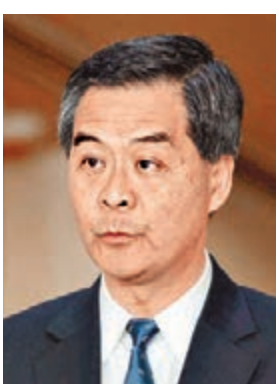
梁振英表示，希望最新零售數字可讓社會進一步討論內地遊客來港的政策。

香港文匯報訊（記者 鄭治祖）內地個人遊旅客大量來港，令人質疑香港的接待能力，更引發是否調減來港內地旅客的討論。行政長官梁振英昨日上午表示，希望同日下午公布的最新零售統計數字，可以讓社會對內地遊客來港的政策進一步討論。