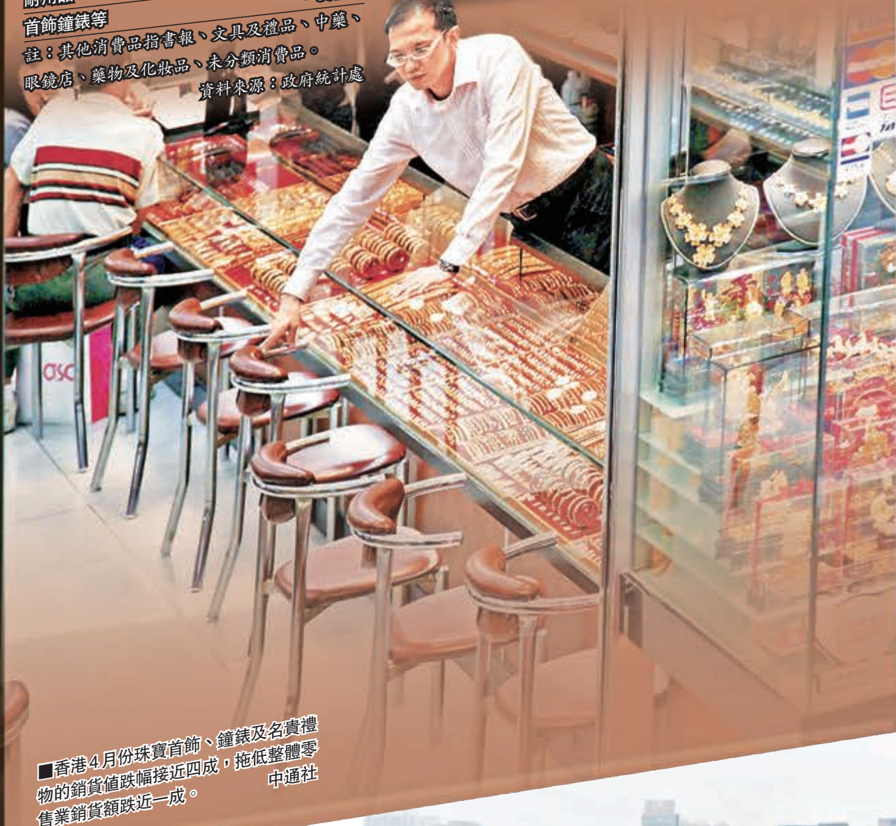
香港4月份珠寶首飾、鐘錶及名貴禮物的銷貨值跌幅接近四成，拖低整體零售業銷貨額跌近一成。