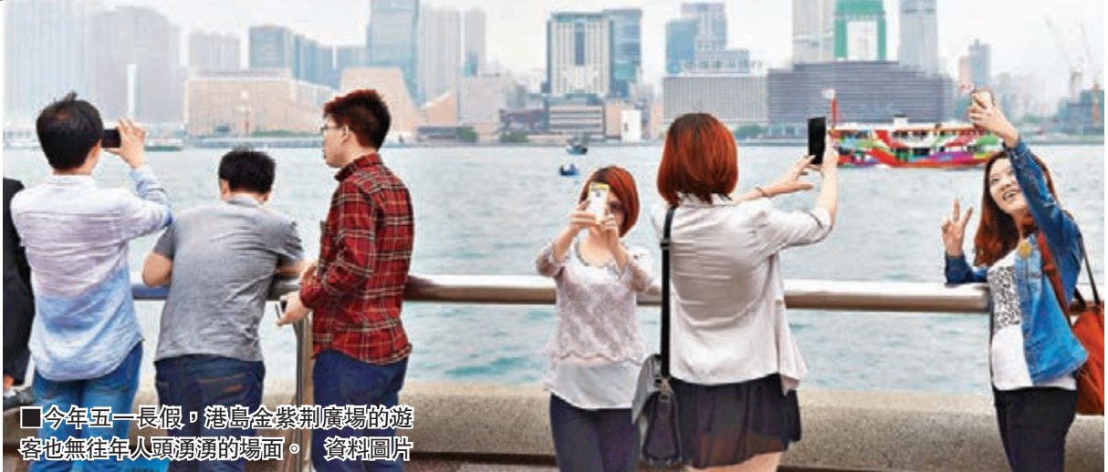
今年五一長假，港島金紫荊廣場的遊客也無往年人頭湧湧的場面。