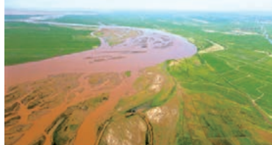
■美麗的中寧平原。