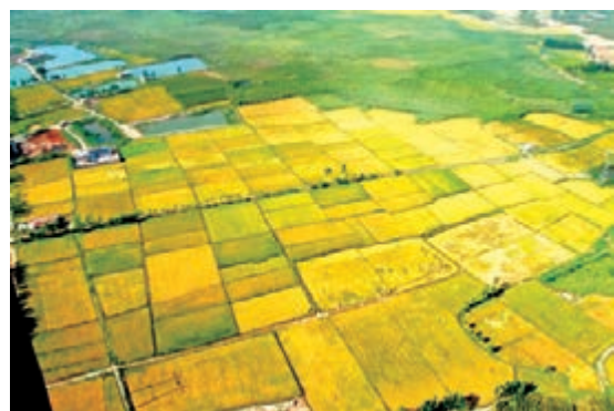
■美麗的中寧平原。

公司依靠科技創新和科研機構的支撐，與中國環境科學研究院、清華大學、中南大學等科研院校長期建立「產學研」合作機制，成立了「電解錳清潔生產聯合工程技術中心」、「寧夏電解錳生產研究院士工作站」和「寧夏電解金屬錳工程技術研究中心」，利用先進技術，提升公司環境治理水平。在科研院所的指導和幫助下，以「節能、降耗、減污、增效」為目標，進行了電解錳生產清潔生產審核，完成了清潔生產審核報告的編制，形成了48個清潔生產方案，已經投資7056萬元實施了45個