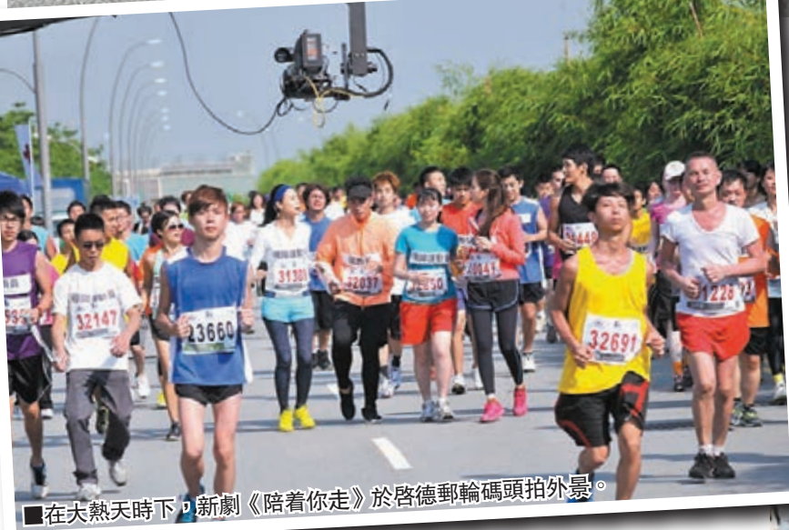
■在大熱天時下，新劇《陪着你走》於啟德郵輪碼頭拍外景。