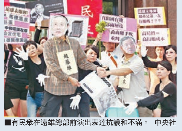
有民眾在遠雄總部前演出表達抗議和不满。

香港文匯報訊 綜合報道，台北地方法院昨日公佈，知名建商遠雄集團董事長趙藤雄、副總裁魏春雄涉嫌行賄前桃園縣副縣長葉世文並標得宜住宅興建案，裁定兩人收押禁見。葉世文涉貪羈押，造成桃園縣府主管層「地震」，桃園縣長吳志揚昨日宣佈，縣府秘書長等5人調離主管職務。未來兩位副秘書長、多位局處的副主管也將暫代主管職務。