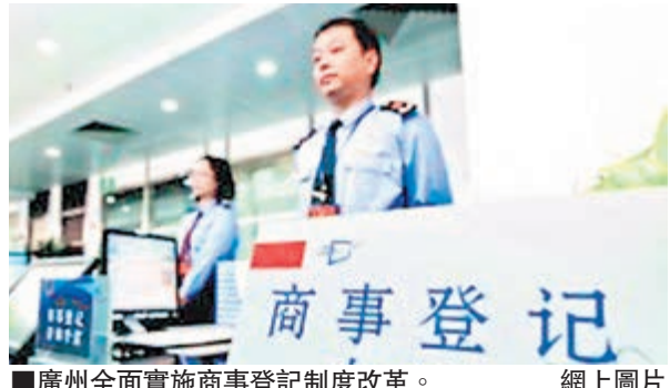
廣州全面實施商事登記制度改革。

香港文匯報訊（記者鍾俊峰廣州報道）中共十八屆三中全會之後，全國各地改革呈現一片奔騰之勢。地處中國改革開放前沿之地的廣東，再當中國改革領頭羊，不僅立即制定了廣東改革路線圖。時至今年6月，廣東已經在商事登記制度、機構改革等方面，邁出了較大的步伐。其中，商事登記改革從3月1日起實行「先照後證」，提速企業註冊登記，改革也將分兩步走，確保今年年底前完成各項任務。