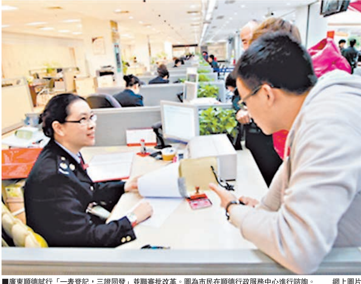
廣東順德試行「一表登記，三證同發」並聯審批改革。圖為市民在順德行政服務中心進行諮詢。

在廣東各地進行過企業註冊登記的工商界人士突然發現，辦理證照明顯提速，工商登記所需的時間，普遍縮短至3個工作日，而深圳、東莞等地甚至可以實現當天辦結。其實，這正是廣東進行商事登記改革的結果。廣東從3月1日起全面推開工商登記制度改革，實行「先照後證」的登記，推行註冊資本認繳登記制等放寬工商登記條件以及強化工商登記後續監管，構建監管體制機制的多項改革措施。