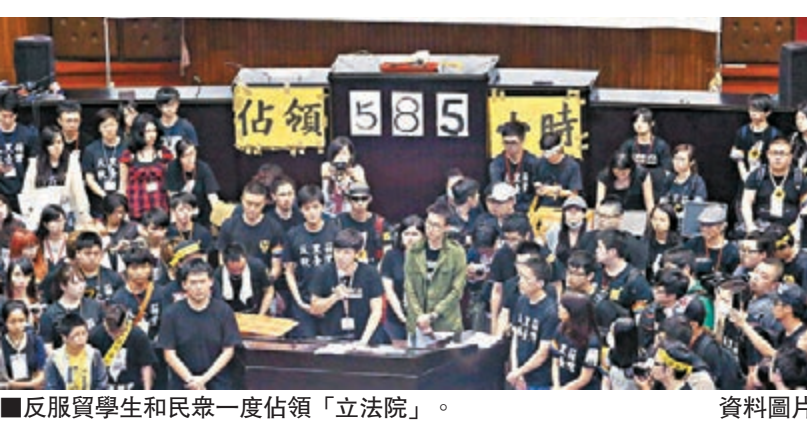
反服貿學生和民眾一度佔領「立法院」。資料圖片