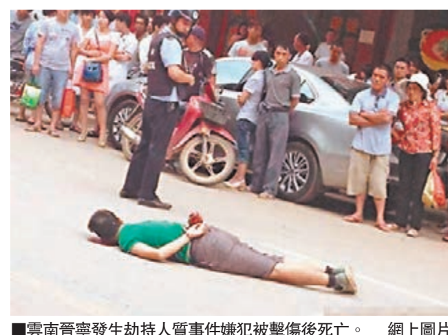
雲南晉寧發生劫持人質事件嫌犯被擊傷後死亡。

前日(31日)下午5時10分許，晉寧縣晉城派出所民警在巡查過程中，發現一可疑男子，上前盤查之際，該男子突然竄進一燒烤店內，手持一把長刀(約20公分)劫持店內一男子。民警立即警告其放下凶器，釋放被劫持人質，但該男子拒不聽從，繼續劫持人質與民警形成對峙，情緒極為激動。後嫌疑人劫持人質欲逃離現場，民警鳴槍警告無效後，為確保人質安全，果斷開槍將其擊傷制服，人質安全獲救。隨後，民警通知120急救中心到現場對受傷嫌疑人進行搶救。