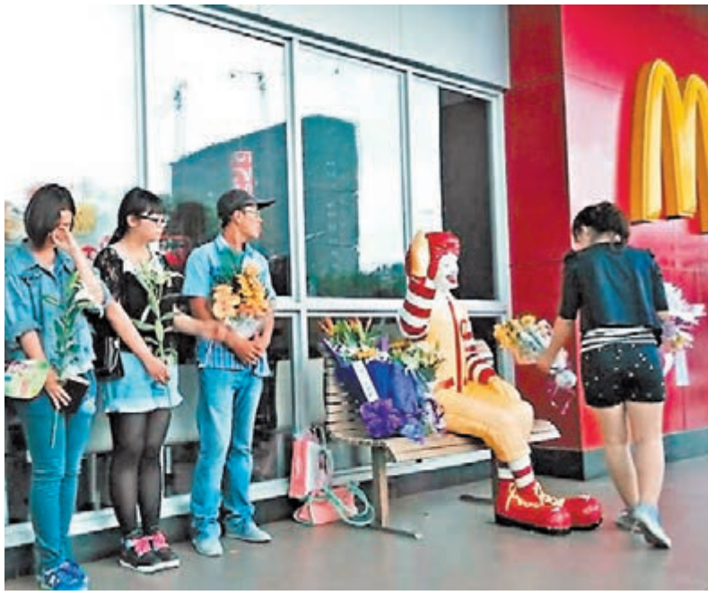
山東招遠一家麥當勞餐廳門口聚集了不少自發前來悼念的民眾，他們手持鮮花、表情哀傷，一些人不禁痛哭。

香港文匯報訊 綜合報道，前日(5月31日)警方通報稱山東省招遠市故意殺人案6名犯罪嫌疑人是邪教組織「全能神」成員。為發展教徒和傳教，除拉關係、關心感化、送錢送物外，女色誘惑、暴力毆打、非法拘禁等都是「全能神」教成員常用手段。曾偵辦過「全能神」組織案件的一名工作人員稱，「全能神」教徒對非信徒暴力毆打、威脅恐嚇、綁架禁錮，甚至殺人的案件曾多次發生。「此次招遠故意殺人案，與上述案件有眾多相似之處。」凡不信及抵制「全能神」的人，均被其成員稱為「撒旦」及「惡靈」。該教設「護法隊」毆打不願入教或欲脫教者；而且組織嚴密，傳教者來往各地不帶手機身份證；該教更宣稱，只有全部身心財產交教主才能在末日得救。